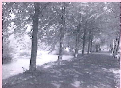
Gebied met groen karakter.

Het concept beheerplan Bloemendaalseweg is op 9 september jl. vastgesteld door het college van B en W. Doel van het plan is behoud en versterking van het cultuurhistorisch karakter van de Bloemendaalseweg. In het beheerplan zijn beleidsuitgangspunten aangegeven op het gebied van bebouwing, water, bruggen, groen, verkeer en archeologie. Ook zijn er maatregelen beschreven, die een bijdrage kunnen leveren aan versterking van cultuurhistorisch karakter van het gebied. Het beheerplan biedt, samen met het aanwijzen van monumenten een mogelijk toekomstig bestemmingsplan voor dit gebied, een goede aanzet voor behoud van dit mooie stukje Gouda.