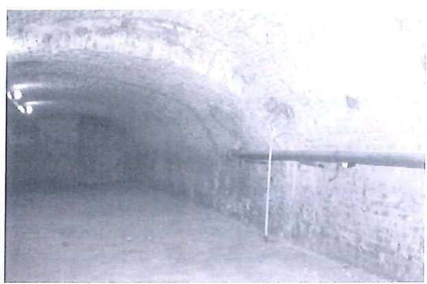
Eén van de indrukwekkende en oude gewelfkelders voor handelsdoeleinden onder een pand aan de Westhaven

Bij het aangeven van de waarde van een kelder in cultuur- of bouwhistorisch opzicht is steeds uitgegaan van twee eigenschappen: allereerst de gaafheid van de betrokken kelder en in tweede instantie ook de indruk die de kelder wekte als drager van verder of, in deze context meer passend, diepergaande historische informatie. Een klein voorbeeld. Wanneer de kelder onder het middelste pand van een heden ten dage aaneengesloten bebouwing van drie panden één of zelfs meerdere dichtgemetselde raam- of deuropeningen in de zijmuur heeft, kan dit bij nader onderzoek interessante informatie opleveren over mogelijk latere verdichting van het stedelijk weefsel ter plekke. Ook kunnen zich nu kelders onder verschillende panden bevinden die vroeger in één pand zijn geweest. Of juist andersom: meerdere kelders onder een pand terwijl zich