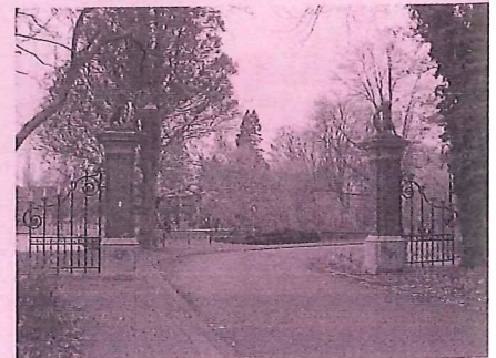
Zuilen bij ingang park.