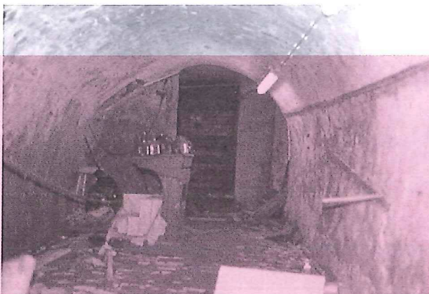
Een zeer oude, tamelijk smalle gewelfkelder met bijna spitsboogvorming gewelf onder een huis in de Dubbele Buurt.

De gemeente heeft ervoor gekozen een gebied te laten onderzoeken dat als het eerste en oudste vestigingsgebied binnen de singels geldt: het voormalige beloop van de Gouwe en de daarvandaan gegraven Haven naar de IJssel. Als bijzonder verbindingsgebied geldt verder de Dubbele Buurt met zijn sluis en gevelwand naar de Wijdstraat en Markt toe. Tezamen met de Oost- en Westhaven, de Hoge- en de Lage Gouwe hebben we het dan over ruim driehonderd panden. Dat is een fors aantal en om van het onderzoek niet een gebed zonder end te maken is gekozen voor een inventarisatie waarbinnen slechts een aantal hoofdkenmerken van de kelder op een standaardformulier is ingevuld. Tevens zijn de adresgegevens van de eigenaar genoteerd. Een overzichtsfoto vergezelde die gegevens. De hoofdkenmerken kwamen neer op lengte, breedte en (grootste) hoogte, de gewelfvorm en de plaats binnen de huisplattegrond. Tevens werden deze gegevens vergezeld van een eerste waardebeoordeling in cultuurhistorisch opzicht in de categorieën 'hoog', 'gemiddeld' of 'laag'.