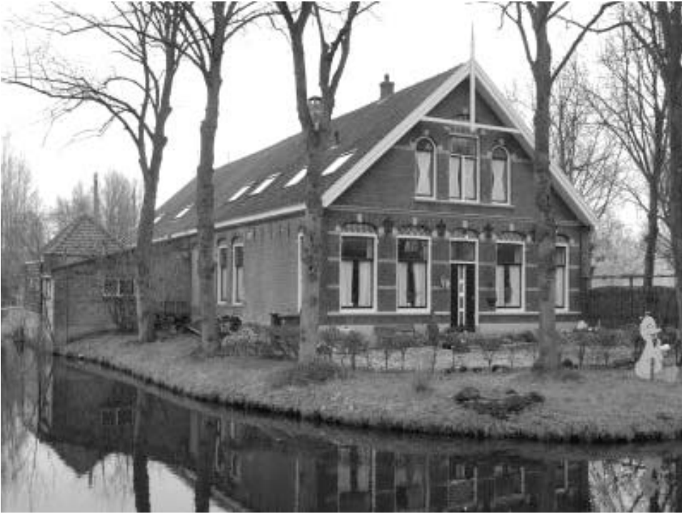
Kinderboerderij 'De Goudse Hofsteden'

zetting. Het is de verwachting dat in de bodem funderingen van vroegere boerderijen, stallen en andere gebouwen kunnen worden gevonden. Vanwege het beschermen van dit bodemarchief is de Bloemendaalseweg op de archeologische Basiskaart van Gouda aangewezen tot vergunningplichtig gebied; wie wil graven heeft speciale toestemming nodig.