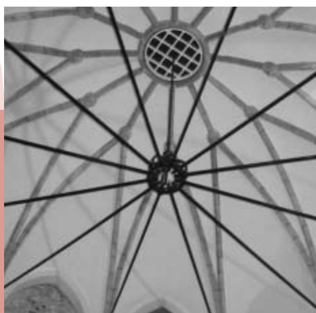
Trekstangconstructie ten behoeve van gewelf

Tijdens de restauratie is een aantal vondsten gedaan. Bij het openmaken van een dichtgemetselde hoek van de kapel kwamen veel oude bouwfragmenten te voorschijn die weer hergebruikt kunnen worden bij de restauratie van de binnen- en buitenmuren. Dichtgemetselde spitsboogvensters in de binnenmuren worden weer gedeeltelijk opengemaakt en beglaasd. Het bestaande glas-in-loodraam in de gevel wordt hersteld en andere ramen krijgen weer glas in lood terug. Nadat deze zomer de restauratie afgerond is, krijgt de kapel een culturele functie. Op dit moment is nog niet helemaal duidelijk welke dat precies zal zijn.