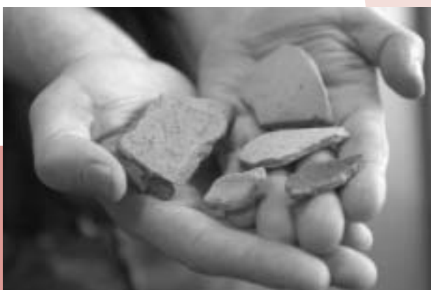
Unieke vondsten uit de Romeinse tijd

Eind vorig jaar zijn de huizen langs de Gouderak sedijk op de riolering aangesloten. Bij het archeologisch onderzoek voorafgaand aan de werkzaamheden zijn diverse oude aardewerk-scherven aangetroffen. Bij de vondst was van één scherf al meteen zeker dat deze Romeins was. De scherf bevond zich echter tussen stukken aardewerk uit latere periodes. Dat betekent dat deze niet meer 'in context' ligt, oftewel dat hij in het verleden al verplaatst is. De scherf kan bijvoorbeeld in de Middeleeuwen door een boer van zijn land opgeraapt en meegenomen zijn. Daarmee zegt dit brokstuk dus niets over de aanwezigheid van eventuele Romeinse sporen op de plek waar hij gevonden is. Een hoeveelheid andere scherven lag wel 'in context' en leek op het eerste gezicht ook uit de Romeinse tijd afkomstig. Aardewerkexperts hebben nu aangetoond dat de vondsten inderdaad Romeins zijn. Dit is de eerste keer dat in Gouda meerdere scherven uit die periode op één plaats zijn aangetroffen. Het is waarschijnlijk dat er op die plek meer sporen uit de Romeinse tijd aanwezig zijn, wat binnen Gouda niet eerder is aangetoond. De mogelijke vindplaats is verder niet verstoord door de aanleg van de riolering. Daardoor kan in de toekomst - mocht dat nodig zijn - meer onderzoek gedaan worden op deze interessante plaats. In de volgende nieuwsbrief gaan we hier verder op in.