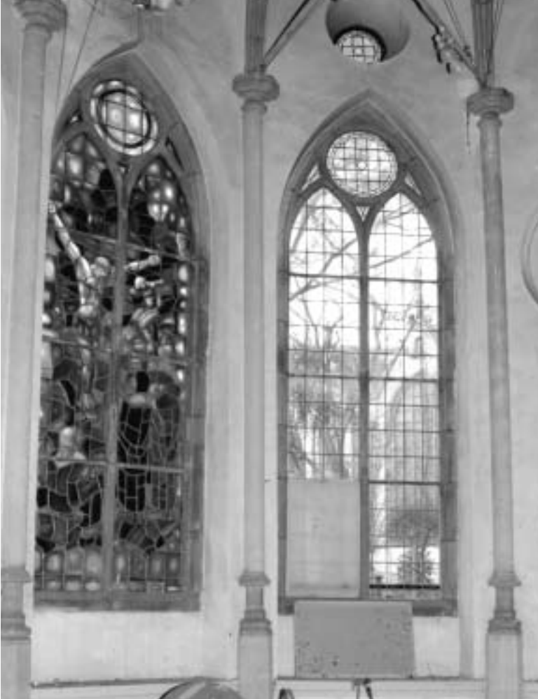
Ramen van de Jeruzalemkapel

en gedeeltelijk geopende spitsboogvensters. In 1860 werden de drie muurvlakken aan de Jeruzalemstraat grondig gewijzigd. De oorspronkelijke spitsboogvensters werden naar beneden doorgetrokken en zo ontstonden de huidige ramen. Daarboven werden kleine ronde vensters geplaatst. Zo ziet de Jeruzalemkapel er aan de buitenkant nog altijd uit.