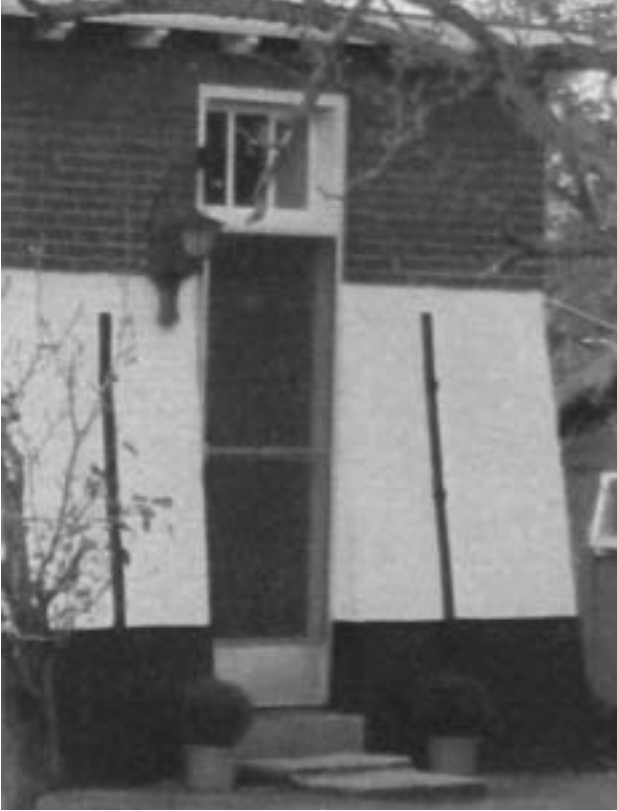
Detail restant molen

gebouwd dat het water van de polders Reeuwijk en Sluipwijk op de Breevaart uitslaat. Ten westen van de sluis, op de dam in de Breevaart, stond ooit de sluiswachterswoning, maar die is allang afgebroken. Ondanks diverse restauraties heeft het Reeuwijkse Verlaat zijn oorspronkelijke karakter behouden. Wie ooit met de fiets of te voet van Gouda naar de Reeuwijkse Plassen is gegaan, zal de smalle houten voetgangersbruggen niet ontgaan zijn. Al eeuwenlang vormen zij een kleinschalige oversteekplaats over de Breevaart. Ook voor de waterrecreant vormt het schutten bij de sluisolk met de nauwe doorgang een opmerkelijke gebeurtenis.