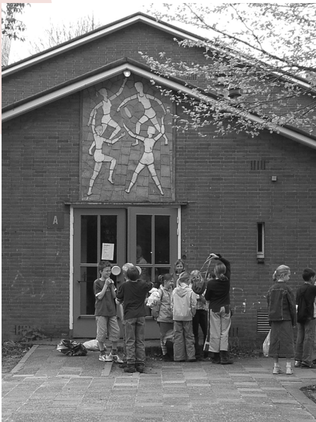
Gymzaal Willem de Zwijgersingel.

werden bijvoorbeeld Vreewijk en Oosterwei in het oosten, Ouwe Gouwe in het noorden en Nieuwe Park in het noord-westen gerealiseerd. Het achterliggend idee voor veel van deze wijken was de wijkgedachte. Dat was een typisch naoorlogse opvatting over de wijkopbouw en vormde in heel Nederland het belangrijkste theoretische uitgangspunt voor de uitbreidingsplannen.