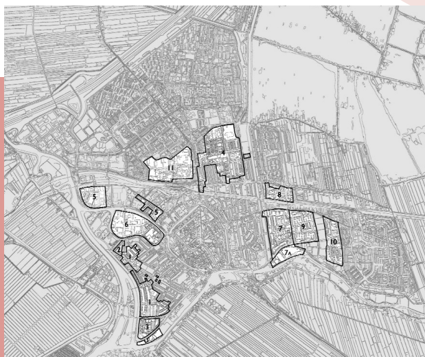
Naoorlogse stadsuitbreidingen van Gouda.

Gouda staat bekend als een monumentenstad door gebouwen rondom de Markt, zoals het Stadhuis, de Waag en de St.Janskerk. Bouwwerken die getuigenis afleggen van een rijke en gevarieerde stadsgeschiedenis. Deze monumenten maken de stad aantrekkelijk en zorgen ervoor dat toeristen de binnenstad weten te vinden. De historische stad is echter het resultaat van een doorlopend proces van uitbreidingen en veranderingen. Tijdsgrenzen van wat eigentijds is en wat historisch is, schuiven op. Minder bekend is dat de architectuur in de naoorlogse uitbreidingswijken die om de binnenstad heen liggen, inmiddels ook tot het historische erfgoed gaan behoren. Niet voor niets. Elke periode brengt bijzondere architectuur en stedenbouw voort. Dat is van groot belang voor de bewoners in