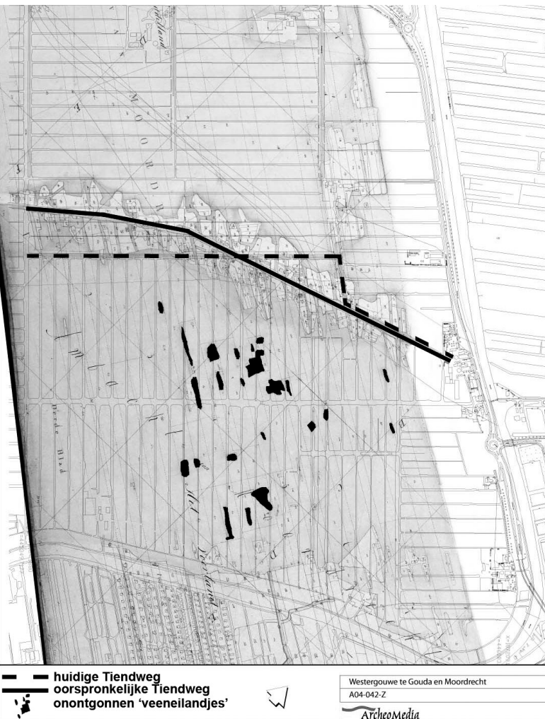
kaart 2: kadastrale projectie loop oude en nieuwe Tiendweg + ligging veeneilandjes (kaart van ArcheoMedia BV).

den is dat er op deze eilandjes boerderijen stonden van waaruit de omliggende veengronden werden afgegraven. Het enige wat uiteindelijk niet werd weggegraven, was het eigen erf.