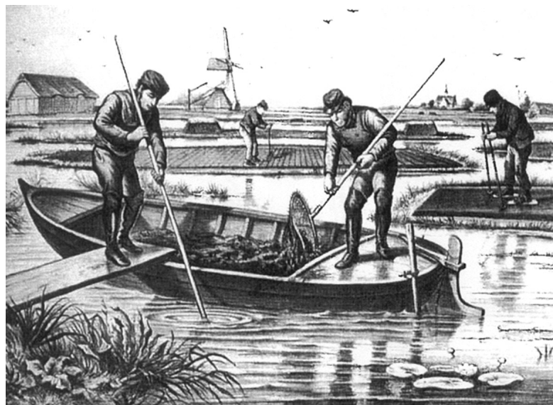
Het 'slagturven' waarbij het veen van onder de waterspiegel wordt opgebaggerd en op legakkers te drogen wordt gelegd.

Een ander doel van de boringen is om vast te stellen waar precies de grens ligt van de aangetoonde houtskoolconcentraties. Waarom is dit van belang? Omdat als we werkelijk te maken hebben met