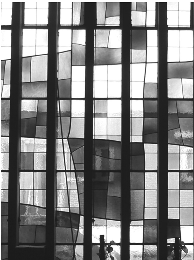
Zijraam St.-Jozefkerk Aalberseplein.

deze wijken. Ook relatief jonge monumenten dragen bij aan de kwaliteit van de leefomgeving en het gevoel van welbevinden.