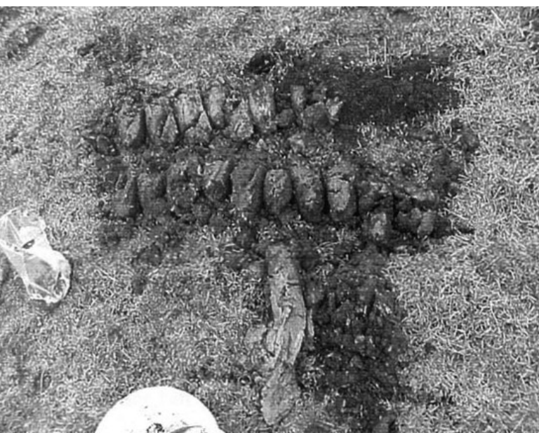
Opgeboord veen en klei.

Als er daadwerkelijk sporen van prehistorische bewoning op de kreekrug liggen, is dit heel bijzonder. Voor Gouda, omdat hier nog niet eerder zulke oude sporen zijn aangetroffen, maar ook voor west-Nederland. Bewoning uit het Mesolithicum is tot nu toe namelijk niet aangetroffen op rivierafzettingen. We wachten daarom in spanning de uitkomsten van de onderzoeken af!