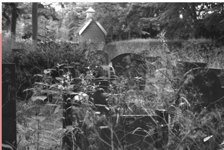
Sfeervol impressie begraafplaats met baarhuisje.

Mede door de inspanningen van deze stichting werd de oude begraafplaats in 1997 officieel aangewezen als gemeentelijk monument. In een eerdere fase waren reeds de in classicistische stijl uitgevoerde aula van rond 1840 en het toegangshek verheven tot rijksmonument. Inmiddels is ook het baarhuisje in originele toestand gerestaureerd. De stichting is erg actief. Zij houdt zich onder meer bezig met het in kaart brengen van het grafregister en het verzorgen van de restauratie van grafmonumenten. En zo is de oude begraafplaats uitgegroeid tot een bijzondere plek in Gouda.