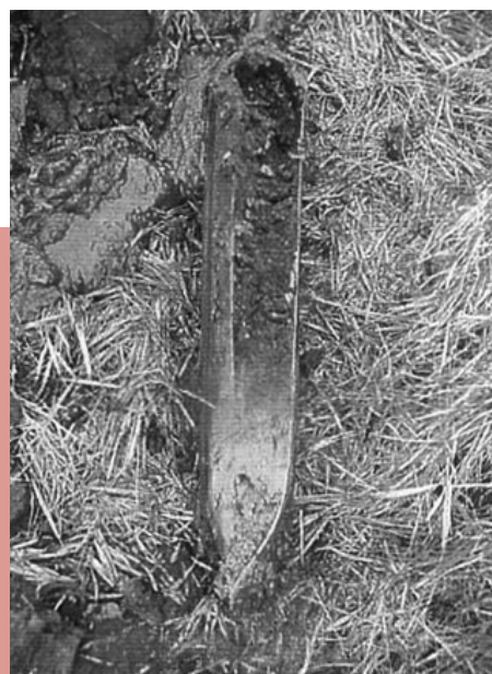
Monstername met een veenboor.