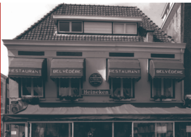
Belvédère voor de brand.

Belvédère is een gemeentelijk monument met een negentiende-eeuws uiterlijk met daarin een oude kern. De dakkapel stamt uit de jaren dertig van de vorige eeuw. De oude kern is ondanks de brand nog gedeeltelijk intact. Het pand bezit een gepleisterde gevel die op de begane grond van schijnvoegen is voorzien. De aangebouwde serre is van een recentere datum. Al sinds 1458 is bebouwing op die plek bekend. Het is dan ook zeer markant gelegen op de hoek van de Hoogstraat, de hoofdweg naar de Markt en de Markt zelf.