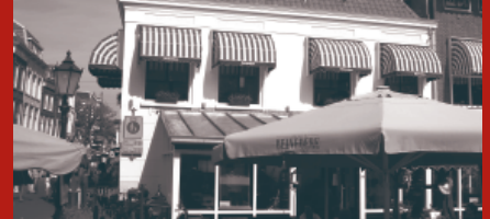
Belvédère weer opgebouwd 11

In juli en augustus is in de Goudse binnenstad gewerkt aan de nieuwe riolering en extra voorzieningen voor de opvang van overtollig hemelwater. Omdat de kans dat we archeologische resten zouden aantreffen zeer groot was, heeft er archeologisch onderzoek plaats gevonden.