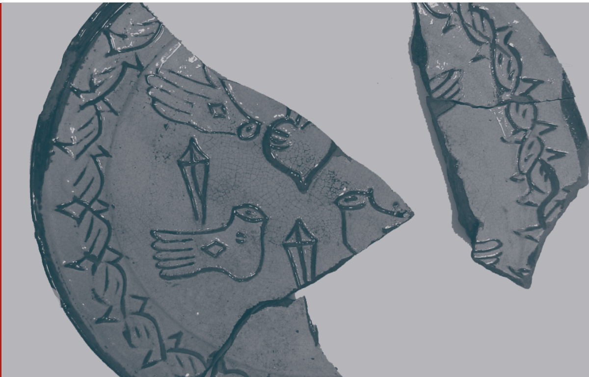
De scherven van het Sgraffittobord uit 1450-1500.

De opgravingen en begeleidingen van de rioolsleuven hebben erg veel leuke resultaten opgeleverd. Zeker aangezien het vrij kleine sleufjes waren. Het geeft maar weer eens aan dat er in Gouda nog van alles te vinden is! Als het uitwerken van de vondsten nog nieuwe inzichten oplevert, dan stellen we u daar in de volgende nieuwsbrief van op de hoogte. Ook de resultaten van de rioleringswerkzaamheden aan de Graaf Florisweg komen dan aan de orde.