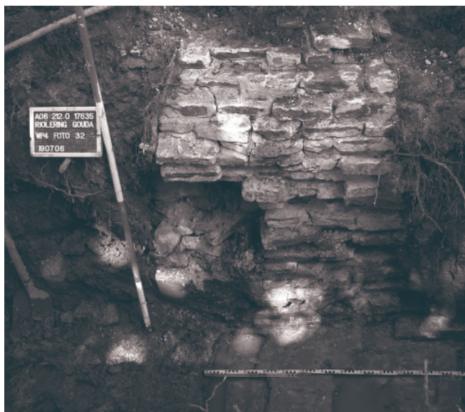
Doorsnede door de stadsmuur ter hoogte van de Groeneweg. Het stuk met de witte stenen is later toegevoegd als aanbouw of reparatie.

Die begeleidingswerkzaamheden hebben resultaat gehad: de stadsmuur is inderdaad aangetroffen, zowel bij de doorsteek vanuit de Groeneweg als vanuit de Geuzenstraat. Op beide plaatsen lagen de restanten vlak naast het wandelpad door het Houtmansplantsoen, op nog geen veertig centimeter beneden het maaiveld. De muur is onderaan ongeveer 1,20 meter dik, naar boven toe wordt hij smaller met een dikte van 65 tot 89 centimeter. De onderkant zit te diep om bereikt te worden. Bij de Groeneweg was duidelijk te zien dat er een extra stuk muur tegen de stadsmuur aan is gemetseld met een ander soort stenen. Of het hier gaat om een steunbeer of om een reparatie is nog niet zeker.