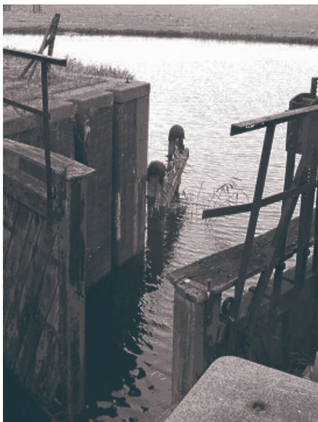
Sluisdeur bij de Alpher wetering.

nieuwe verbinding tussen de twee rivieren. Pas in 1922 werd het besluit genomen om het Gouwe-IJsselkanaal aan te leggen. Hierdoor werd de Moordrechtse Tiendeweg verdeeld in een Eerste en een Tweede Moordrechtse Tiendeweg. Door de aanleg van het kanaal werd ook de Oostpolder gesplitst in een noordwestelijk en een zuidoostelijk deel. Het zuidoostelijke deel bestaat uit de wijken Kromme Gouwe en Korte Akkeren. En het noordwestelijke deel is de huidige Oostpolder. Door de aanleg van het kanaal verdween een groot gedeelte van het Land van Thuil en werd de Alpher Wetering verlegd.