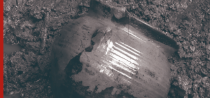
landschapspark Oostpolder 8