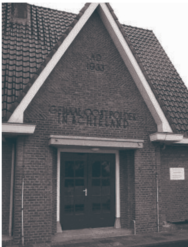
Elektrisch gemaal aan de Broekweg.