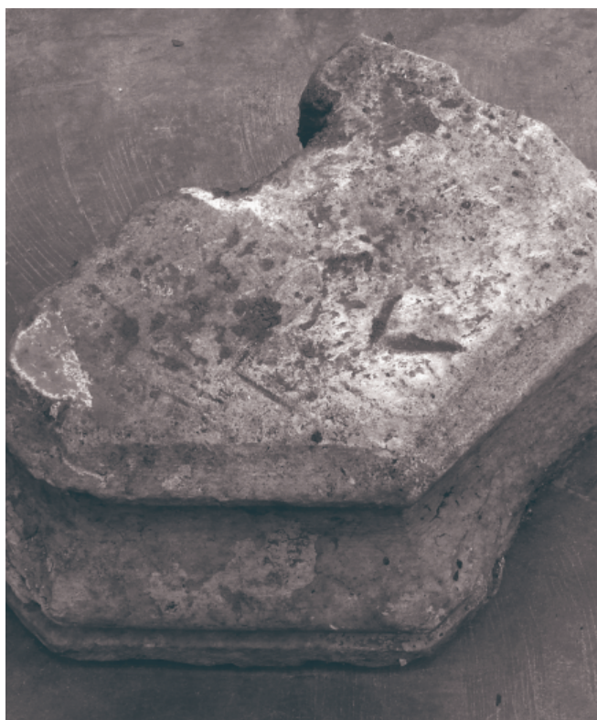
Natuurstenen basis van een zuil, mogelijk afkomstig uit het Cellebroedersklooster.