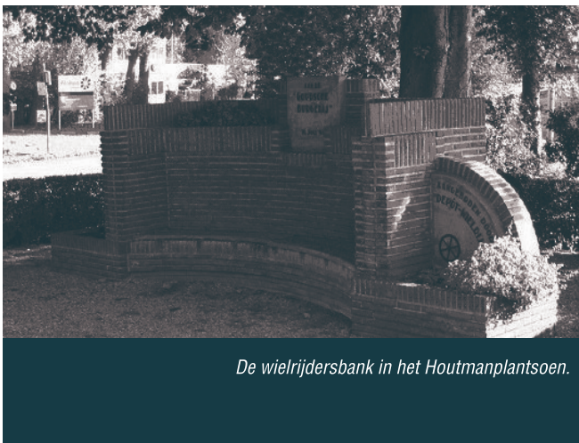
De wielrijdersbank in het Houtmanplantsoen.

Zoals in de vorige nieuwsbrief te lezen was, krijgt de Sacramentskerk in Korte Akkeren een nieuwe bestemming als gezondheidscentrum. Voor het altaar van de Sacramentskerk moest daarom een nieuwe behuizing gevonden worden. Dat was geen gemakkelijk opgave. Maar binnenkort krijgt het altaar een plek in de rooms-katholieke Jozefkerk aan het Aalberseplein. Het altaar is al gedemonteerd en wordt tot de verhuizing opgeslagen.