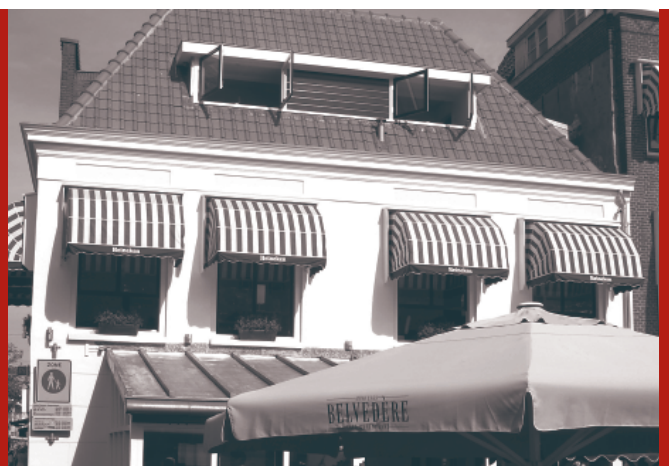
Belvédère na de brand.