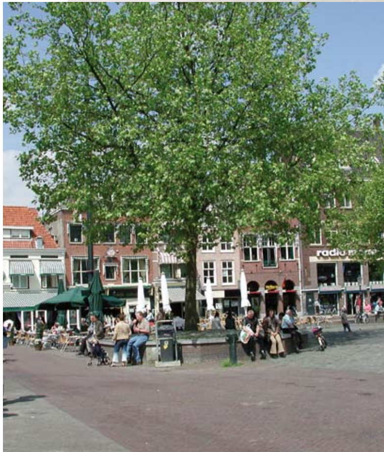
Eén van de vier bekende platanen op de Markt

Oude bomen staan meestal in de buurt van oude gebouwen. Ze zijn dus vooral te vinden in de Goudse binnenstad, in de ring van wijken daar direct omheen (Korte Akkeren, Nieuwe Park, Kadebuurt en Kort Haarlem) en langs enkele oude wegen zoals de Voor- en Achterwillenseweg, de Bloemendaalseweg en de Gouderaksedijk.