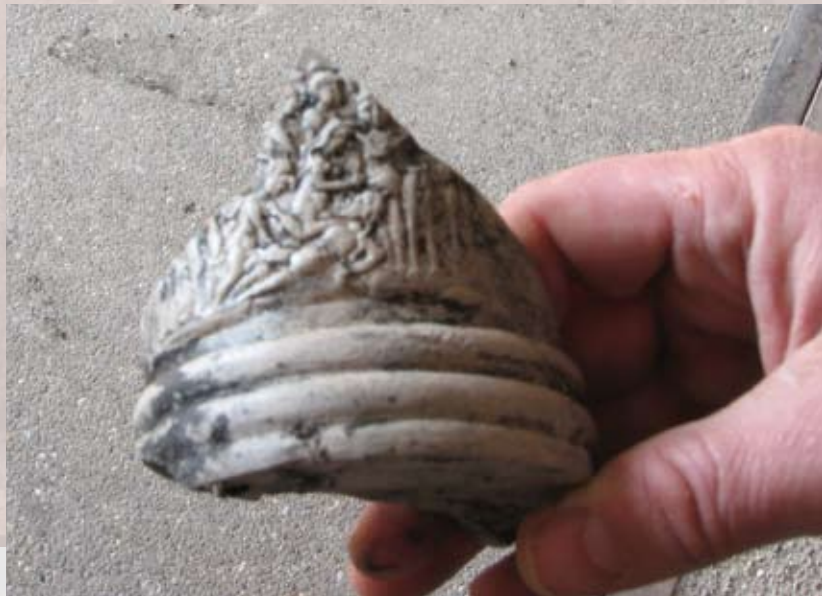
Scherf met erotische afbeelding

Ook als de ligging en omvang van de kapel vooraf wel bekend waren geweest, zou deze dus opgegraven en grotendeels verwijderd zijn ten behoeve van het bouwplan. Die opgraving zou hetzelfde zijn geweest als de opgraving die nu is gedaan. Ook de resultaten zouden hetzelfde zijn geweest. Een groot deel van het muurwerk moest hoe dan ook weg, dat viel niet te vermijden. Maar alle informatie is wel bekend en blijft voor de stad behouden!