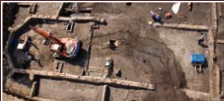
Fundering kapel gevonden