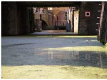
De Donkere sluis