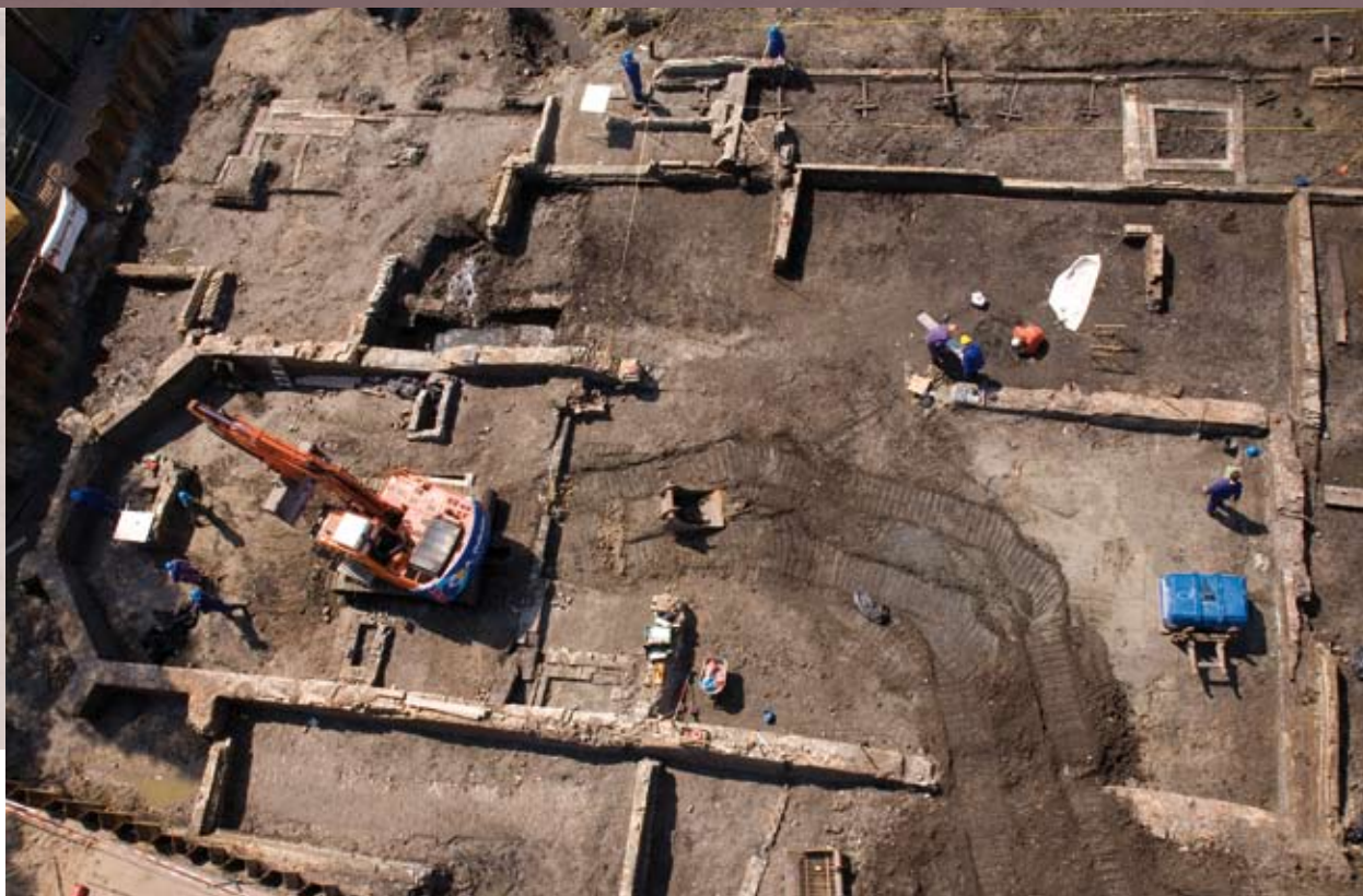
De opgraving op het terrein