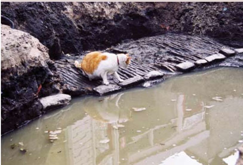
18 e eeuwse straatje

Na de plunderingen werd het klooster gesloten. Hierna werden de kloostergebouwen gebruikt als armenhuisvesting. De kapel en het bijbehorende terrein werden gebruikt als stadstimmerwerf, tot aan de sloop in 1690.