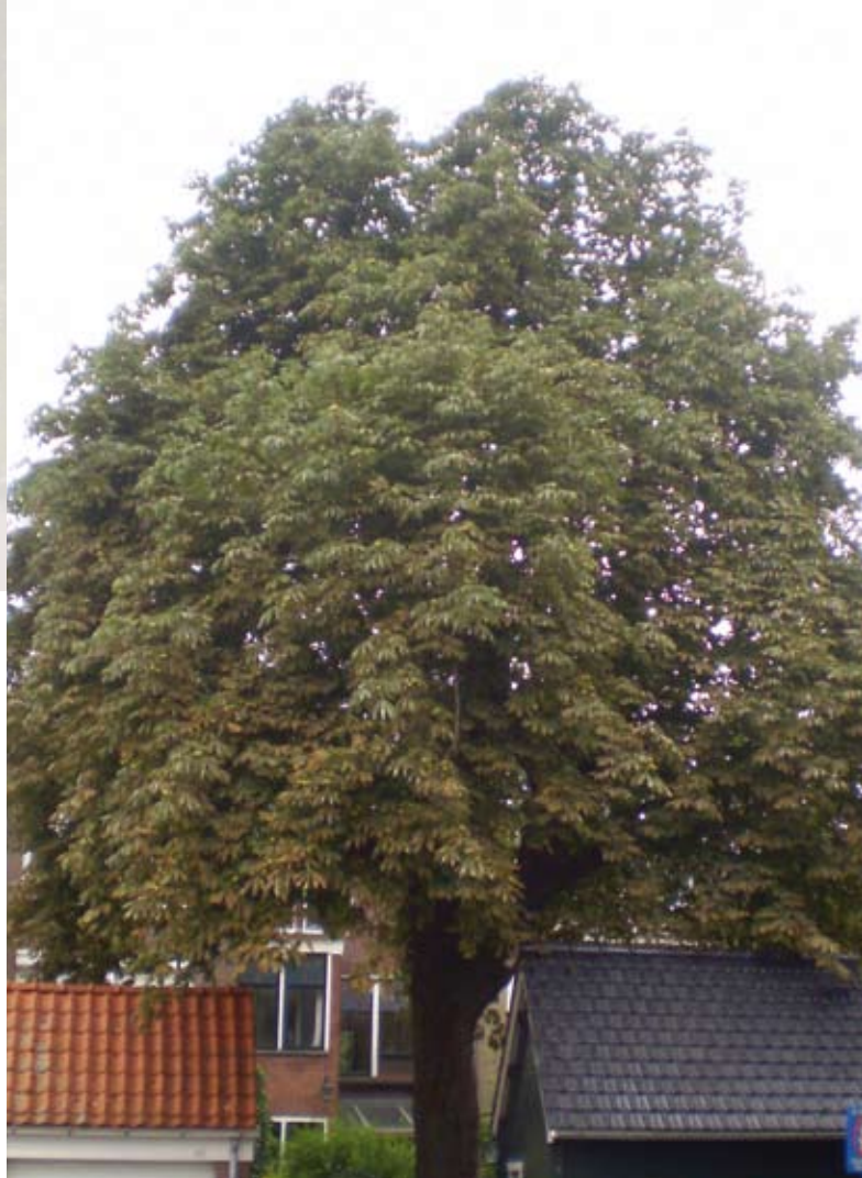
Eén van de vele oude paardekastanjes; deze staat achter de Turfsingel in een tuin

Meestal hebben de oude bomen een sierfunctie. Maar soms hadden ze van oorsprong een nuttige functie. De bomen moesten bijvoorbeeld de zon uit de voorkamers van de boerderij houden waar kaas werd gemaakt en opgeslagen. Voor die functie werden de bomen dan ook nog eens in leivorm gesnoeid, zoals lindes of paardekastanjes. In de binnenstad en omliggende wijken hebben de bomen vrijwel uitsluitend een sierfunctie als begeleiding van grachten en singels. De bomen zijn sfeerbepalend in de oude parken en tuinen.