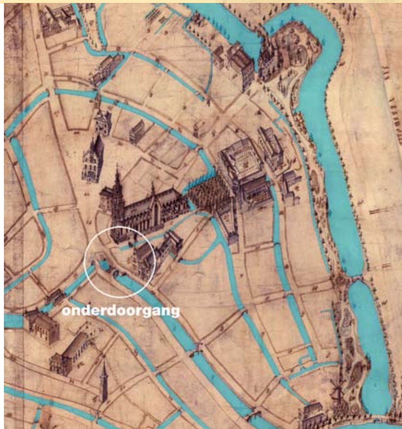
Historische kaart uit 1847

Met de restauratie van de onderdoorgang wordt een gedeelte van het unieke Goudse waterstelsel in ere hersteld. De onderdoorgang is een belangrijk onderdeel van het Goudse historische waterstelsel. Dit waterstelsel wordt nationaal en internationaal zeer interessant gevonden en krijgt terecht steeds meer aandacht. Het watersysteem