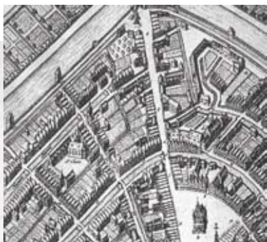
◀ Uitsnede kaart Blaeu ◀ Uitsnede kaart Van Deventer

met een oost-westelijke oriëntatie. Dat was ook gebruikelijk volgens de christelijke traditie. De kaart van Van Deventer uit 1560 toont de kapel op ongeveer dezelfde plaats, maar met een noordwest-zuid-oostelijke oriëntatie. Deze kaart blijkt nu de enige juiste kaart te zijn. Maar dat is in 2003 - bij het begin van het onderzoek - nog niet bekend. Op basis van de kaart van Blaeu, en in mindere mate die van Braun en Hogenberg, wordt de proefsleuf daarom gepland op het voorste deel van het terrein. Op deze plek zijn de meeste mogelijkheden voor eventuele inpassing van de kapel.