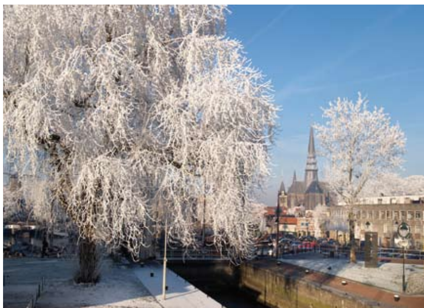
Prachtig winterbeeld van een suikeresdoorn naast de Mallegatssluis

Het Houtmansplantsoen ligt op een plek waar vroeger de versterking van de ommuurde stad Gouda lag. Waarschijnlijk lag daar vroeger ook het kasteel van Gouda. Een voordeel voor de bomen is dat deze plek daarom naar verhouding hoog ligt en bomen daar dieper kunnen wortelen. Het Van Bergen IJzendoornpark en Nieuwe Park liggen op oorspronkelijke veengrond. Deze grond is vroeger op bescheiden schaal met as uit de stad opgehoogd en een paar jaar terug gewoon met grond. Het park