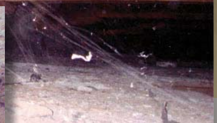
De gemetselde gewelven van de onderdoorgang