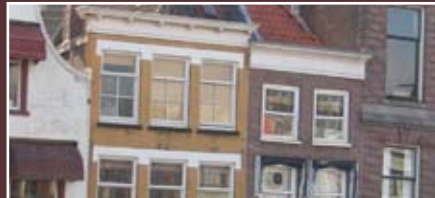
Kijk eens omhoog naar Markt 4