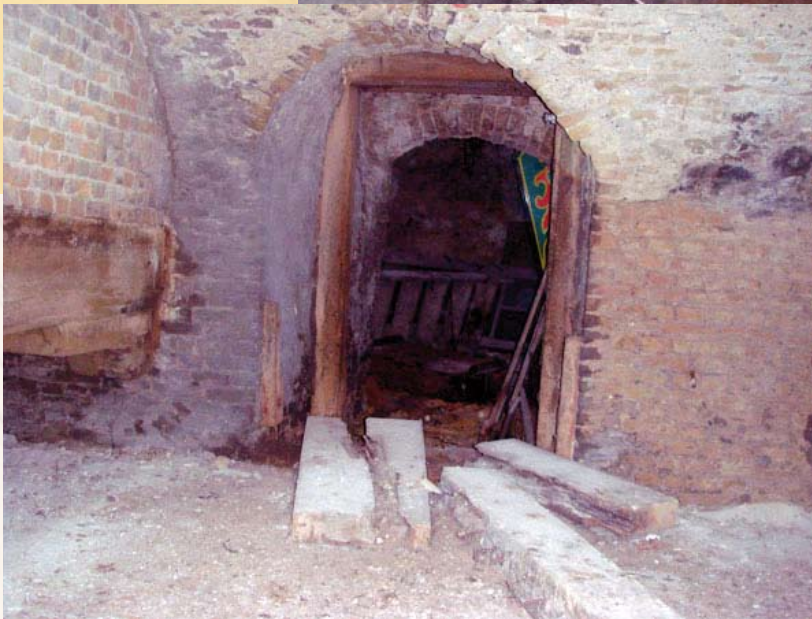
Kelder in de onderdoorgang