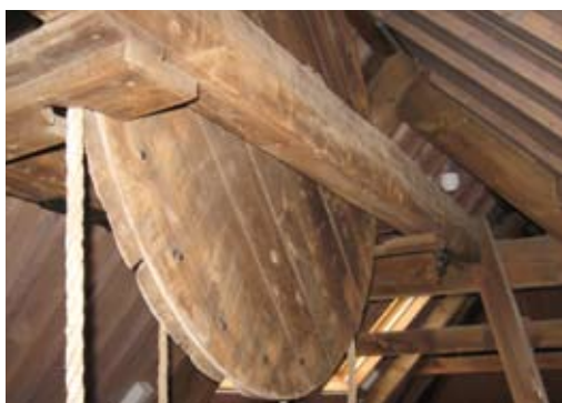
Met dit hijswiel werd de was omhooggetakeld om op de zolders te dragen

De slechte staat van de Drie Notenboomen had vooral te maken met lekkages. Hierdoor hadden onder meer het metselwerk, de muurplaten, de vloeren en de spanten te lijden gehad en moesten vervangen worden. De kap was in redelijke staat. Van de oorspronkelijke kapconstructie was veel over zodat deze goed gerestaureerd kon worden.