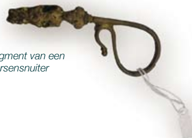
Fragment van een kaarsensnuit

Ook deze 17 e eeuwse scherf, gevonden op de Agnietenstraat, lijkt op het eerste gezicht misschien niet zo bijzonder. Toch is hij dat wel, want op deze scherf staat - in zwart - het wapen van Gouda afgebeeld. Iets wat we bijna nooit zien! Waarom het wapen er op staat en van wie het aardwerk was, is onzeker. Mogelijk gaat het om aardewerk dat het stadsbestuur gebruikte of om een gift van de stad Gouda aan een notabele.