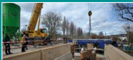
Het unieke Gouds watersysteem