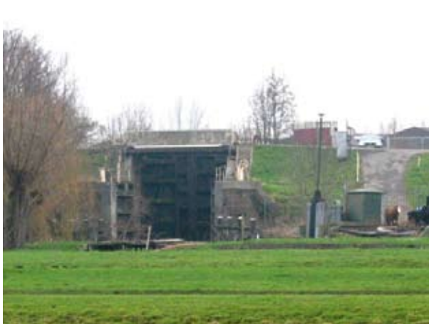
Zicht op de Stolwijkerschutsluis en de Gouderaksedijk

Aan de Hollandsche IJssel in de Gouderakse dijk ligt de Stolwijkerschutsluis. De sluis is sinds 1990 rijksmonument. Vanaf dat moment hebben verschillende regionale en lokale partijen zich ingezet voor restauratie. Dat was lange tijd niet mogelijk, maar nu gaat het toch echt gebeuren. De restauratie start in de loop van 2010 en moet voor 1 januari 2012 afgerond zijn. De sluis