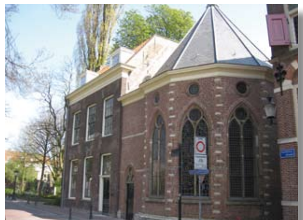
Jeruzalemkapel met naastgelegen 18 e eeuwse woning

bruik van het complex met de gebruikers geëvalueerd. Het Streekarchief Midden-Holland wordt de hoofdhuurder van het complex en brengt haar publieksfuncties met name op de begane grond van het complex onder. De ruimten op de verdiepingen gaan gebruikt worden door de Bibliotheek en het Historisch Platform. Een mooie combinatie van gebruikers die de historie van Gouda een warm hart toedragen. De opening van de Jeruzalemkapel wordt verwacht in september 2010.