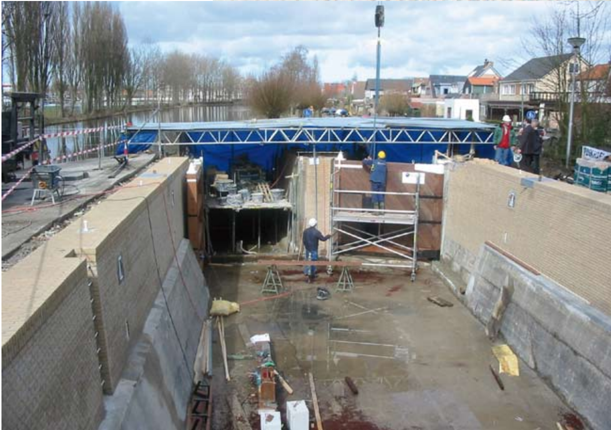
Bij de restauratie is onder andere de derde deur weer teruggeplaatst

verschillende waterhoogte, gescheiden door een smalle kade. De ene wetering liep langs de Bodegraafse Straatweg en werd ook wel Vaarwetering genoemd. De andere wetering liep naar de polder Sluipwijk en liep over in de vaart langs de Platteweg en werd Reeuwijkse wetering genoemd.