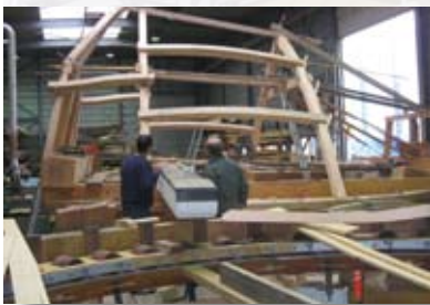
Molenkap waarop later het riet geplaatst is