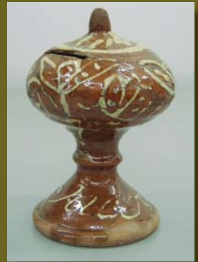
18 e eeuwse spaarpot met op de voet de naam Jacob

Deze spaarpot zal bij verschillende Gouwenaren wel bekend zijn. Hij heeft bijvoorbeeld deel uitgemaakt van de tentoonstelling 'Onze oude burens' in 2003. Het is om verschillende redenen een bijzondere vondst. De spaarpot dateert uit de periode 1740 -1780. Hij is beschilderd met plantenmotieven en op de voet is de naam van de eigenaar geschilderd: Jacob. Waarschijnlijk was dit een kind dat de spaarpot voor zijn verjaardag kreeg. Jacob heeft zijn spaarpot kennelijk nooit gebruikt: de spaarpot werd leeg maar onbeschadigd teruggevonden. Ook zonder inhoud was hij echter waardevol genoeg om te stelen: in 1997 werd hij door inbrekers gestolen uit een tentoonstelling. Een paar jaar later werd hij bij toeval teruggevonden bij een antiquair in Amsterdam. Dubbel ontdekt dus, en nu veilig opgeslagen in het Goudse depot!