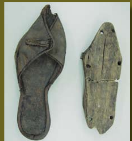
Leren schoen en houten trip

Ook afkomstig van Westhaven 65, maar gevonden op een veel grotere diepte dan het zwaard, is deze houten trip. Dit exemplaar is voorzien van metalen strips en dateert rond 1400. Trippen zijn een soort onderschoenen die als zool onder de normale schoenen werden gedragen. Dat was nodig, omdat de wegen in de Middeleeuwen vaak slecht waren en dus modderig en nat. Om de leren schoenen te beschermen tegen modder en kou, werden de trippen onder de schoenen gebonden. In het Goudse depot liggen heel veel leren schoenen: door de hoge grondwaterstand blijft het leer goed bewaard in de Goudse bodem. De schoen op de foto is gevonden in de Patersteeg en dateert rond 1500.