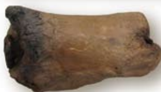
Werpootje met loden spijker

kootjes rechtop konden worden gezet. Vervolgens werden ze met een werpkoot omver geworpen. De werpkoot werd hiervoor uitgeoord en verzwaard en gevuld met lood. De overige koten werden gemarkeerd met ingesneden merktekens en gaven waarden of eigendommen aan. De koten hebben van nature twee verschillende zijden. De bolle voorkant werd 'stooft' genoemd. De holle achterkant werd met 'schijf' aangeduid.