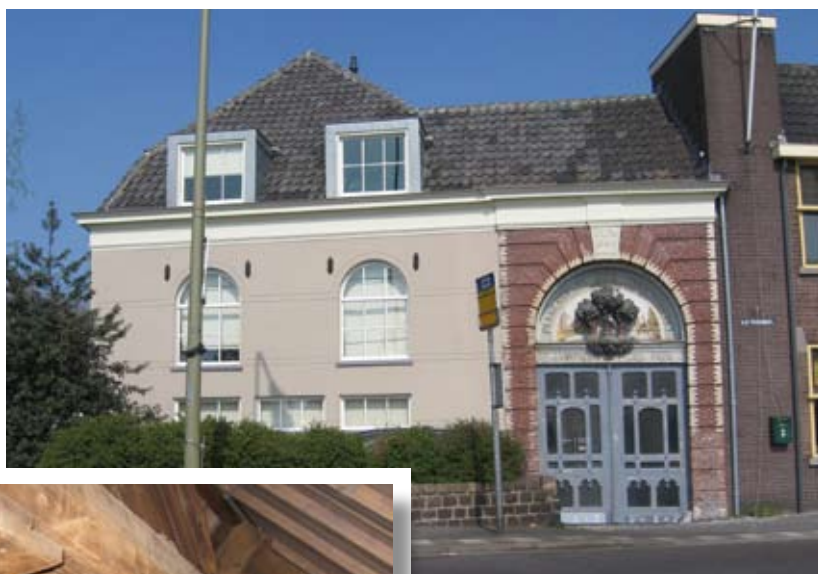
Boven de ingang zijn de drie notenboomen te zien

de eerste verdieping te laten zakken en de vloer van de zolderverdieping omhoog te plaatsen. Hierdoor zijn er behalve een hoge begane grond ook twee goed te gebruiken verdiepingen met voldoende hoogte ontstaan.