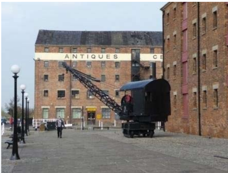
Reconstructie van de haven met gerestaureerde pakhuizen

en winkels is ook het nationaal watermuseum en het stadhuis in een van de pakhuizen gevestigd. Naast de reconstructie van het havengebied zijn er zes andere gebieden aangewezen voor herontwikkeling zoals het stadscentrum, gebieden langs vervallen kanalen en het stationsgebied. In een periode van 10 jaar pakt het GHURC met heel veel geld van de landelijke overheid zeven grootschalige reconstructies op. Met deze aanpak wil het een nieuw hoofdstuk in de geschiedenis van Gloucester te schrijven.