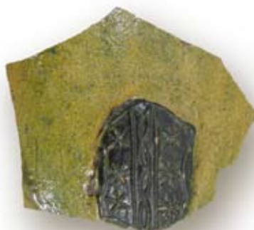
Scherf met het wapen van Gouda

Middeleeuwse teksten en afbeeldingen wijzen erop dat het kootspel vooral door kinderen werd gespeeld. Met dit op het oog saaie stukje bot heeft een groep kinderen in de 17 e eeuw dus enorm veel plezier beleefd. En, verder fantasierend, hoeveel ruiten zullen door dit werpkootje gesneuveld zijn, met als gevolg een spannende achtervolging door een boze schout?