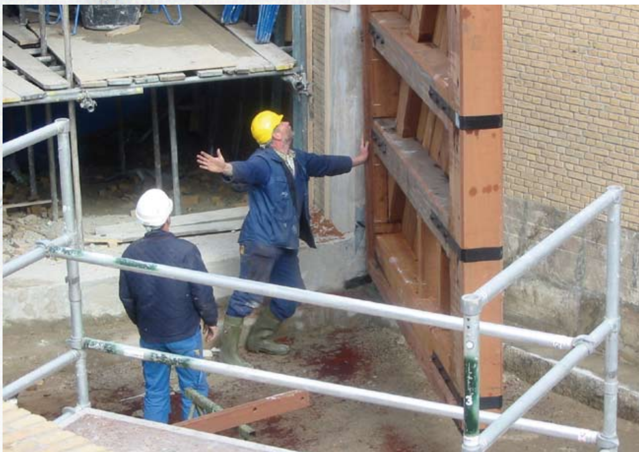
Plaatsing van de nieuwe deur