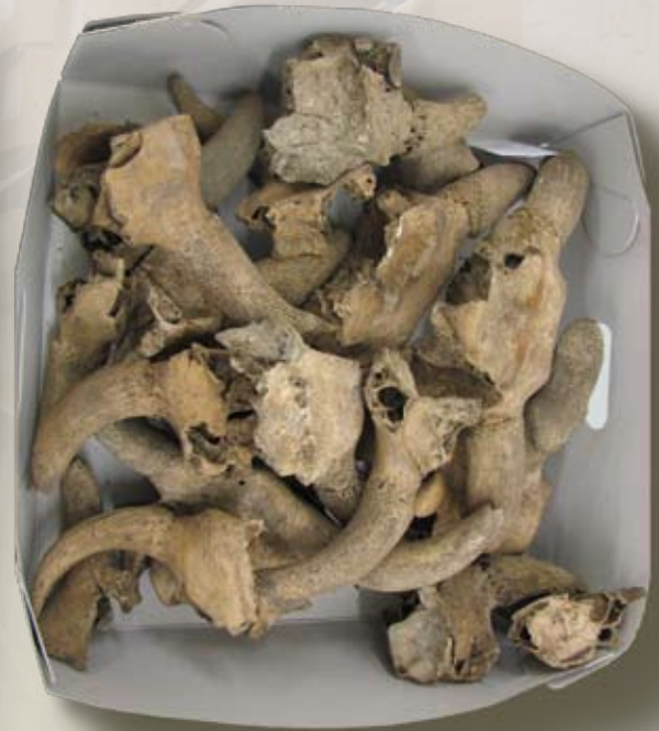
17 e eeuwse runderschedels, gevonden op de Gregorius Coolstraat