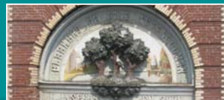
Drie Notenboomen prachtig gerestaureerd