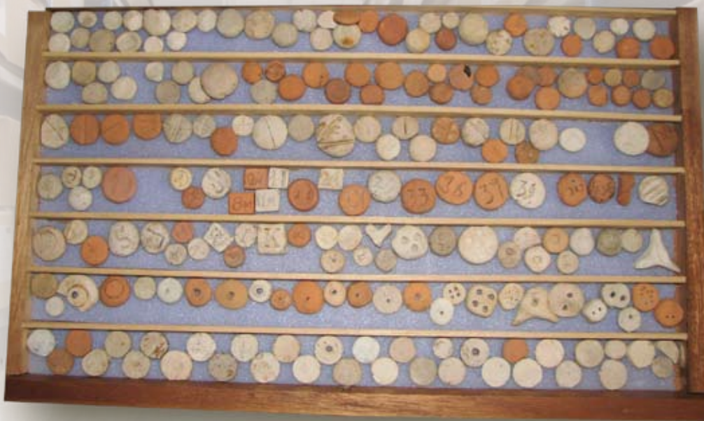
Verzameling grospenningen uit de Drapiersteeg.

Lijkt het u leuk om zelf te assisteren bij het herinventariseren? Dat kan: op maandagavonden vanaf 19.30 uur kunt u terecht bij de werkruimte van de Archeologische Vereniging Golda, Achter de Kerk 1 (in de tuin van het museumgouda). Wellicht tot dan!