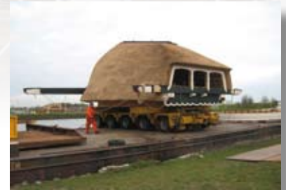
Vervoer over het water van de nieuwe kap

Aan de Mallemolen, gelegen aan de 1 e Moordrechtse Tiendweg bij het voormalige Uiverplein, vindt een grote restauratie plaats. Het rijksmonument wordt in oorspronkelijke staat gereconstrueerd.