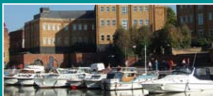
Geschiedenis van partnerstad Gloucester