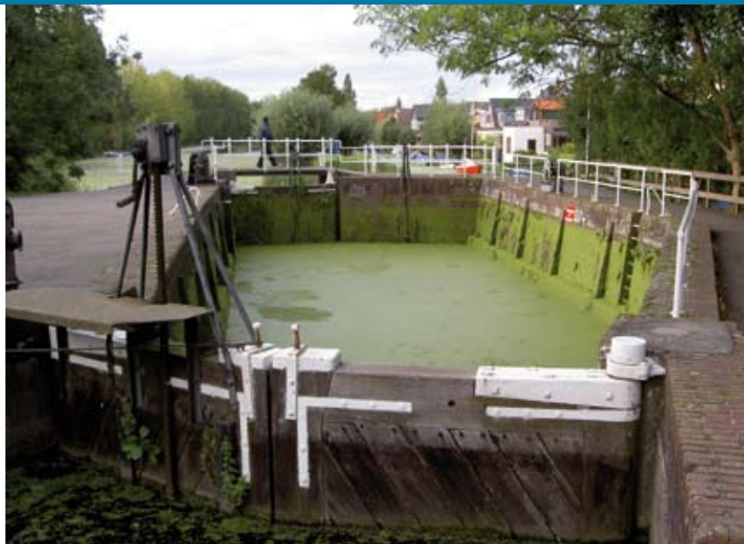
Reeuwijks verlaat vóór de restauratie. Op de plek waar oorspronkelijk de deur naar de Sluipwijkse polder was, staat nu een muur

De Goudse geschiedenis is onlosmakelijk verbonden met water en dat heeft haar sporen nagelaten. Gouda dankte in de middeleeuwen haar welvaart aan de internationale scheepvaartroute die door de binnenstad liep. In de Haven en Gouwe liggen als herinnering daaraan nog steeds het Amsterdams Verlaat, de Donkere Sluis en de Havensluis die gezamenlijk de langste schutsluis van Europa vormen. Omdat Gouda aan de getijdenrivier de Hollandsche IJssel ligt, kon zij gebruik maken van het hoge water voor het schoonhouden van het watersysteem. De kracht die dit gaf, spoelde de grachten schoon; het zogenaamde 'schuren'. In de achttiende eeuw werd hiervoor de Donkere Sluis van zogenaamde kruisende deuren voorzien zodat de waterkracht optimaal werd gebruikt. De kruisende deuren van de Donkere Sluis zijn nog steeds aanwezig. Daarmee is het een bijzonder monument want het is de enige sluis met dit systeem in Nederland. Voorjaar 2009 is de onderdoorgang