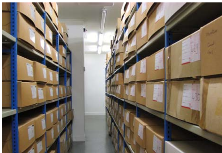
Dozen in het Archeologisch Depot Gouda

In het archeologische depot van Gouda liggen alle bodemvondsten die ooit in Gouda zijn gedaan. Opgeslagen in lange rijen dozen. Maar wat zit er precies in die dozen? Dat was tot voor kort voor veel dozen onduidelijk. Daarom is de gemeente dit samen met de Archeologische Vereniging Golda gaan herinventariseren. Met verrassende ontdekkingen!