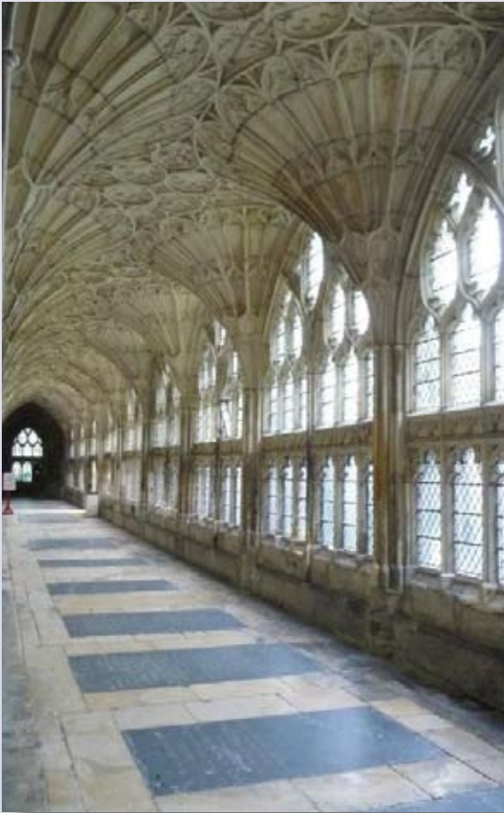
Kloostergang van de kathedraal met waaiergewelven