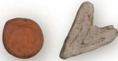
Twee grospenningen uit de Vrouwesteeg

Op de foto ziet u twee zogenaamde grospenningen, gevonden in de Vrouwesteeg. Grospenningen zijn betaalpenningen die werden gebruikt in de Goudse klei- en pijpindustrie. Meestal betreft het eenvoudige bolletjes klei die plat zijn gedrukt tussen de vingers, met wat ingekraste cijfers of tekens. Behalve inkassingen zijn er ook schijfjes bekend met de afdruk van een hielstempeltje van een pijp, de afdruk van een zegelring, een vingerhoed of spijkerkop et cetera. In de 18e eeuw werd ook wel een duitafdruk gebruikt. Elke medewerker in het productieproces had een eigen merkje, dat hij/zij bij een afgewerkt gros kleipijpen legde. Aan het einde van de week kregen de werknemers vervolgens uitbetaald op basis van het aantal grospenningen. Grospenningen komen met name