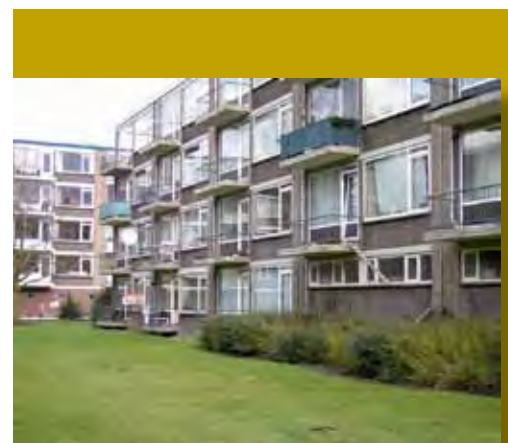
Gallerijflats in de jaren 60 wijk Oosterwei

Het bestemmingsplan is de meest aangewezen plek om het geheel van cultuurhistorische waarden in de ruimtelijke context te verankeren.