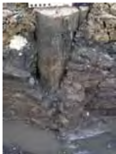
Hoe verstorend is een heipaal?

Op 10 juni 2010 heeft in de Sint-Janskerk in Gouda het congres Archeologievriendelijk Bouwen plaatsgevonden. Op dit congres werden de resultaten besproken van een onderzoek dat door het Convent van