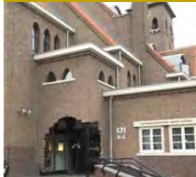
De Sacramentskerk, Korte Akkeren