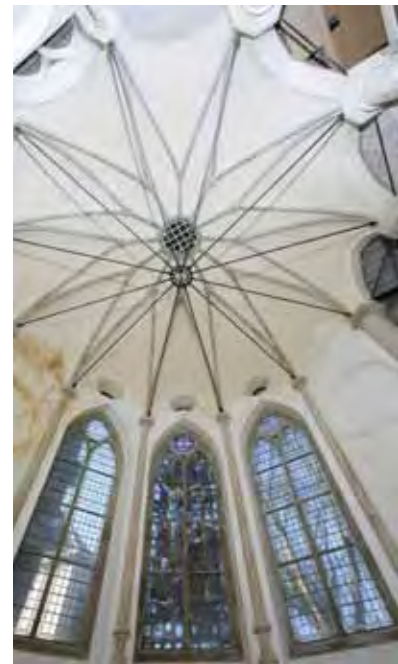
Interieur van de Jeruzalemkapel

en de Jeruzalemkapel hoop ik dat we volgend jaar nog een nieuwe herbestemming aan de lijst kunnen toevoegen”.