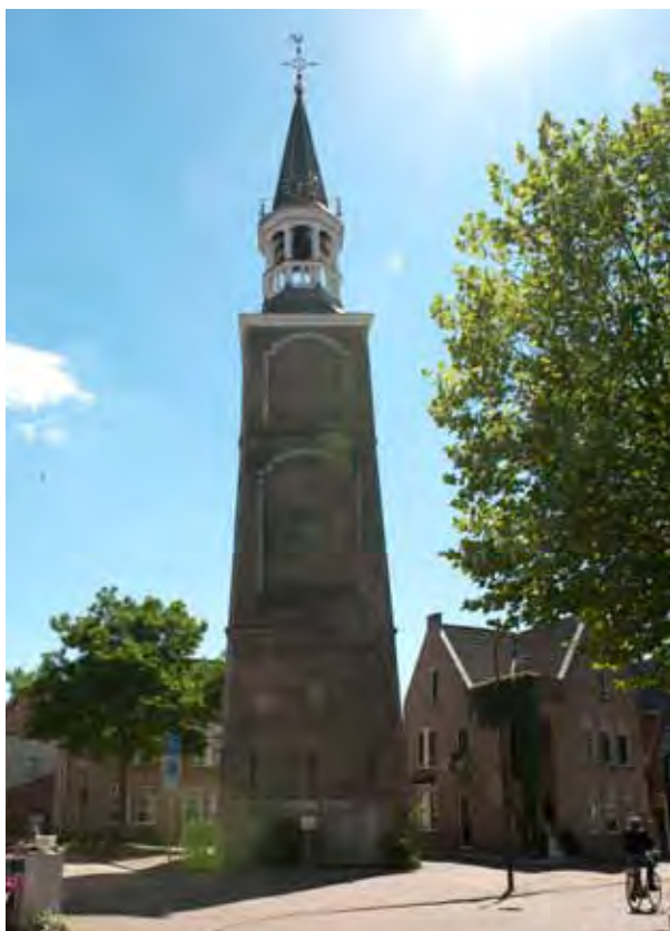
De Onze Lieve Vrouwetoren aan de Nieuwe Haven

Meer informatie over rijksmonumenten en interessante links vindt u op Wikipedia, als u zoekt naar 'rijksmonument' en 'monumentenzorg'.