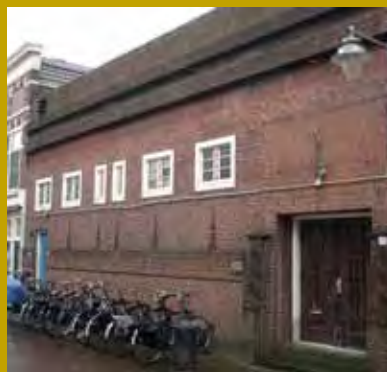
Het leegstaande Badhuis op de Lange Groenendaal in de binnenstad