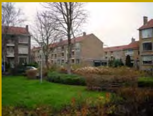
Portiekflats in de jaren 50 wijk Ouwe Gouwe

Burgers in het algemeen en eigenaren van monumentale panden in het bijzonder zullen meer speelruimte krijgen. De betrokkenheid van en de instandhouding door particulieren is altijd al groot geweest en de rol van burgers in de monumentenzorg wordt steeds groter.