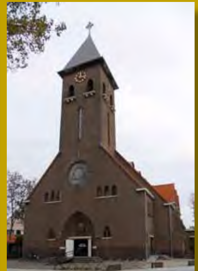
De Sacramentskerk, Korte Akkeren

sing kan verschillen. Natuurlijk zijn er monumenten waarbij de 'transformatieruimte' niet zo groot is. Het Stadhuis op de Markt in Gouda leent zich niet voor een ingrijpende herontwikkeling. Heel anders is dat echter bij de woonwijk Oosterwei in Gouda-Oost. Daar is het maatschappelijk (ook vanuit de optiek van de monumentenzorg) zeer gewenst om de bijzondere stedenbouwkundige setting van de wederopbouw als inspiratie te gebruiken en een zinvolle 21e eeuwse functie te geven. Aanpassingen aan cultuurhistorisch waardevolle zaken hoeven niet per definitie waardeverlies met zich mee te brengen.