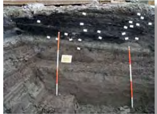
Een profiel (dwarsdoorsnede) door het Bolwerk. Zie de verschillende lagen in de Goudse bodem.

Een opgraving valt altijd wel onder één van de algemene thema's, dus is er altijd reden om onderzoek te doen.