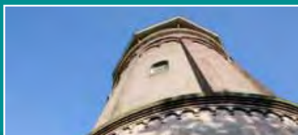
Open Monumentendag 7