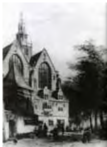
De St. Janskerk

In september organiseerde Wikimedia Nederland, samen met de vrijwilligers van Wikipedia, de fotowedstrijd Wiki Loves Monuments ( wikilovesmonuments.nl ). Wikimedi