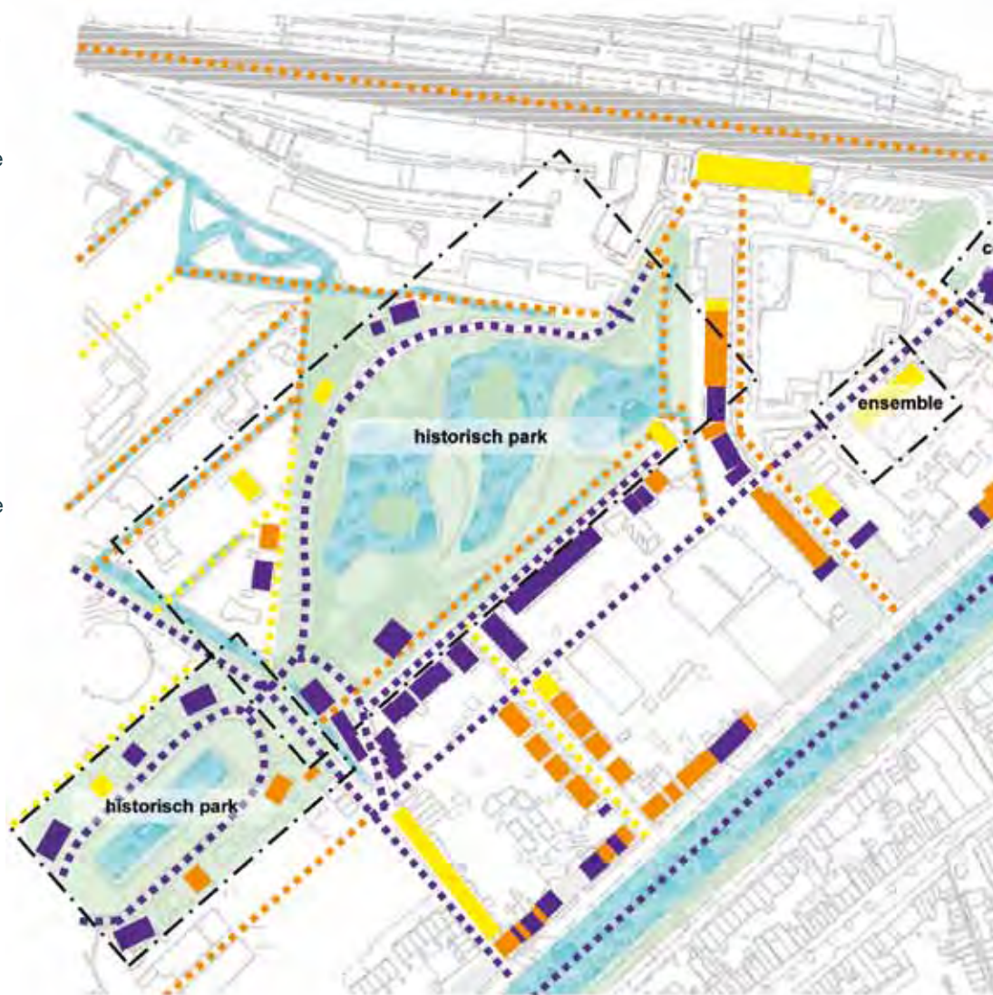
Cultuurhistorische waarden in beeld

De overgrote meerderheid van monumenteigenaren is trots op zijn monument en bereid om extra moeite te doen en extra kosten te maken om het te onderhouden. In het vernieuwde beleid krijgt de monumenteigenaar daarom meer ruimte. De inzet is om de eigenaren meer vrijheden en keuzemogelijkheden te geven en hen optimaal te faciliteren. De monumentenregelgeving zal eenvoudiger worden gemaakt door bijvoorbeeld de procedures, die geen of geringe meerwaarde leveren voor het monument, maar wel als een aanzienlijke last