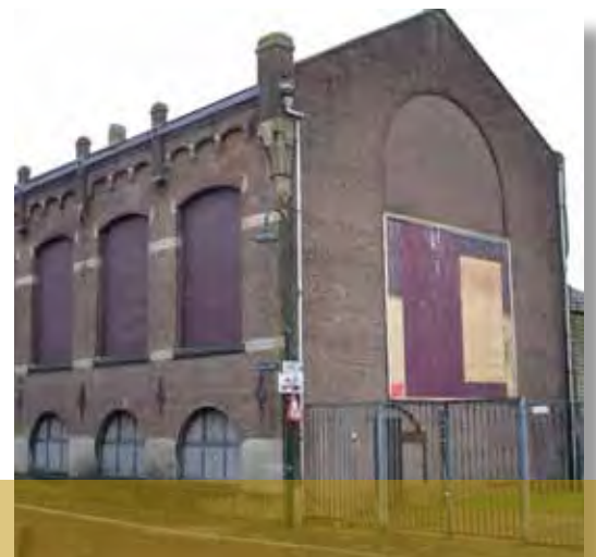
De Lichtfabriek op het Bolwerk

worden ervaren door de eigenaar, te vereenvoudigen. Daardoor zal er meer ruimte ontstaan voor wat echt een meerwaarde kan leveren: transformatie en herbestemming van panden, complexen, landschappen en naoorlogse woonwijken.