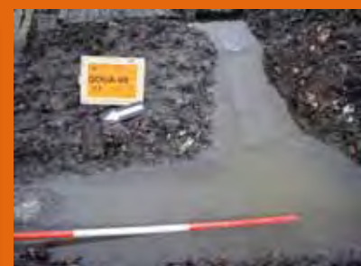
Waterproblematiek bij opgravingen