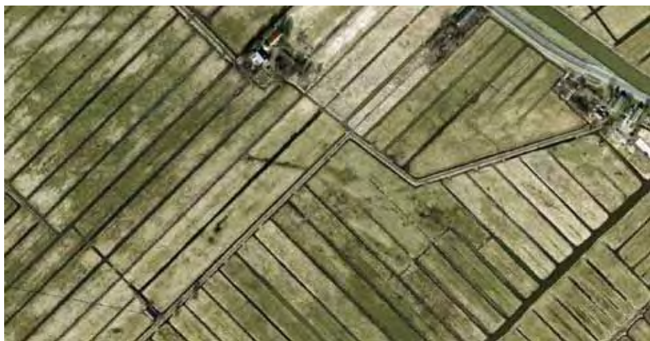
Sporen van ontginning: verkavelingspatronen in Westergouwe. Centraal op de foto is de oude ontginningsweg nog zichtbaar, maar waar lagen de ontginningsboerderijen?

De ontginning van het veen heeft een enorme invloed gehad op het ontstaan van Gouda en op de vorm die de stad nu heeft. Er is al veel bekend over de ouderdom, volgorde en richting van de ontginningen, maar er zijn nog delen waar dit onduidelijk is. Ook is er nog veel onduidelijkheid over de plek waar ontginningsboerderijen te verwachten zijn. Dat laatste maakt het lastig om een goede archeologische beleidskaart te maken. Het is namelijk