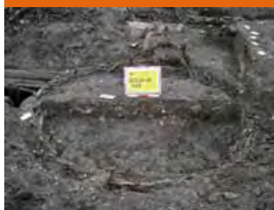
Vlechtwerk waterput uit de ontginningsfase van Bolwerk