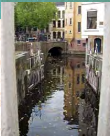
De donkere sluis is, samen met de Havensluis en het Amsterdams Verlaat, de langste schutsluis van Europa

Het thema water biedt een uitstekende mogelijkheid om de archeologie aan te sluiten bij de bovengrondse cultuurhistorie van Gouda. De Goudse geschiedenis is, zoals ook in eerdere nieuwsbrieven aan de orde is geweest, onlosmakelijk verbonden met water en dat heeft haar sporen nagelaten. Gouda dankte in de middeleeuwen haar welvaart aan de (inter)nationale scheepvaartroute die door de binnenstad liep. In de Haven en Gouwe liggen als herinnering daar aan nog steeds het Amsterdams Verlaat, de Donkere Sluis en de Havensluis (gezamenlijk de langste schutsluis van Europa). Deze bovengrondse monumenten hebben echter ook een ondergrondse tegenhanger die minder belicht is. Archeologisch gezien is er namelijk nog veel onbekend van de