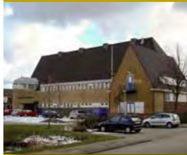
De Goudse Praktijkschool, Kadebuurt

Door het erkennen van de waarden uit de betrekkelijk recente geschiedenis, neemt het potentieel te behouden en te beschermen objecten enorm toe. Denk aan 20e eeuwse kerken, scholen en zelfs hele woonwijken met portiekflats uit de jaren 50. Het is ruimtelijk, financieel en functioneel niet mogelijk om al die objecten onveranderd te behouden. Hier moeten beslissingen genomen worden over gebruiks- en transformatiemogelijkheden. Het is daarbij belangrijk om mee te bewegen met ontwikkelingen in de maatschappij. Waardevolle gebouwen, complexen of buurten horen ook een eigentijdse betekenis te hebben. Bij functieveranderingen moet rekening worden gehouden met de cultuurhistorische waarden. Dit betekent bijvoorbeeld dat historische verkavelingstructuren meegenomen worden bij het inrichten van natuurgebieden of nieuwbouwwijken. Daarnaast moet er sprake zijn van passend gebruik om een waardevol complex in stand te kunnen houden, ook als daarvoor bepaalde ingrepen in de bestaande situatie nodig zijn. De ruimte voor aanpas-