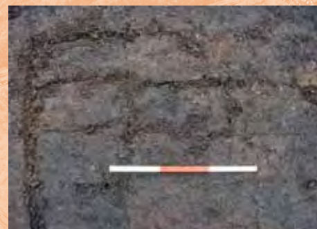
Sporen van ontginning: voorgestoken, maar uiteindelijk niet ontgonnen, veenbroodjes

sluizen, de zijlen en andere waterwegen en waterwerken. We kennen de exacte loop van de oorspronkelijke waterwegen niet, al hebben we wel vermoedens, en ook de datering van de oudste sluis (en eventuele voorgangers) is nog niet archeologisch aangetoond. Daarnaast is de rol die het watersysteem in de afvalverwerking speelde, en de mogelijke link met de weinige beerputten in Gouda, nog niet goed onderzocht. Vandaar dat dit onderwerp als zeer belangrijk wordt gezien, ook als voorbeeld van hoe boven- en ondergrondse cultuurhistorie samen gaan.