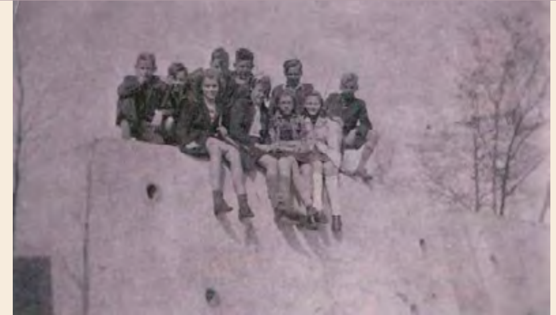
Foto genomen op het blok op de Notaris d'Aumerlielaan

In de jaren dat de muren nog niet waren gesloopt, waren het gewillige objecten om vanaf te springen, de vaart in, en om op te klimmen, getuige ook twee foto's die werden opgestuurd. De eerste is een foto van het blok op de Burgemeester Lucassenlaan, de tweede is genomen op de Notaris d'Aumerlielaan. In beide gevallen dus niet het blok waarvan nu de fundering is opgegraven, maar op basis van alle omschrijvingen is wel zeker dat deze blokken sterk op elkaar leken. Deze twee foto's zijn dus ook een goede indicatie van hoe het blok op de Bodegraafsestraatweg er bovengronds heeft uitgezien.