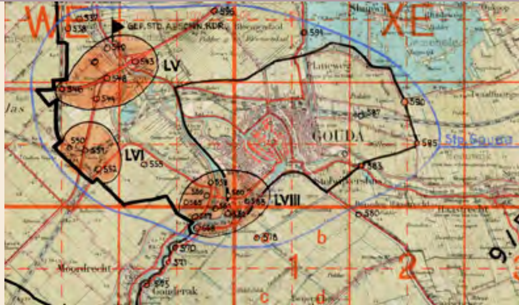
Kaart van stellingen rondom Gouda. De Bodegraafsestraatweg heeft nummer 594.