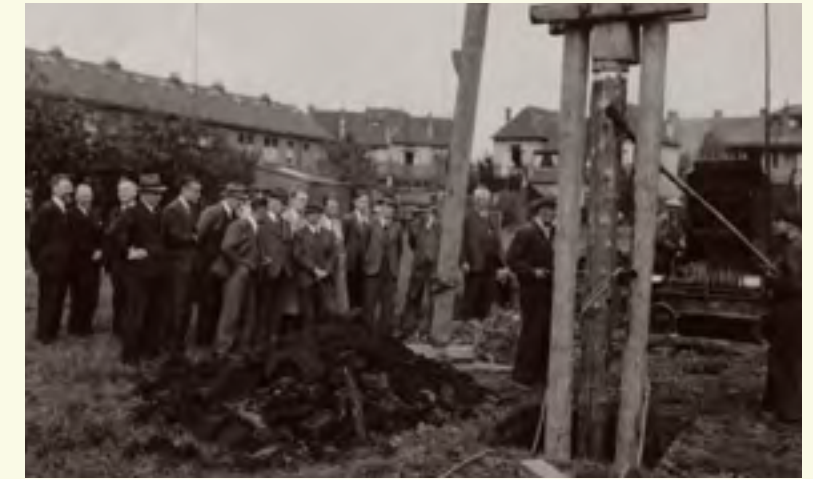
Eerste paal geslagen op 12 juli 1938