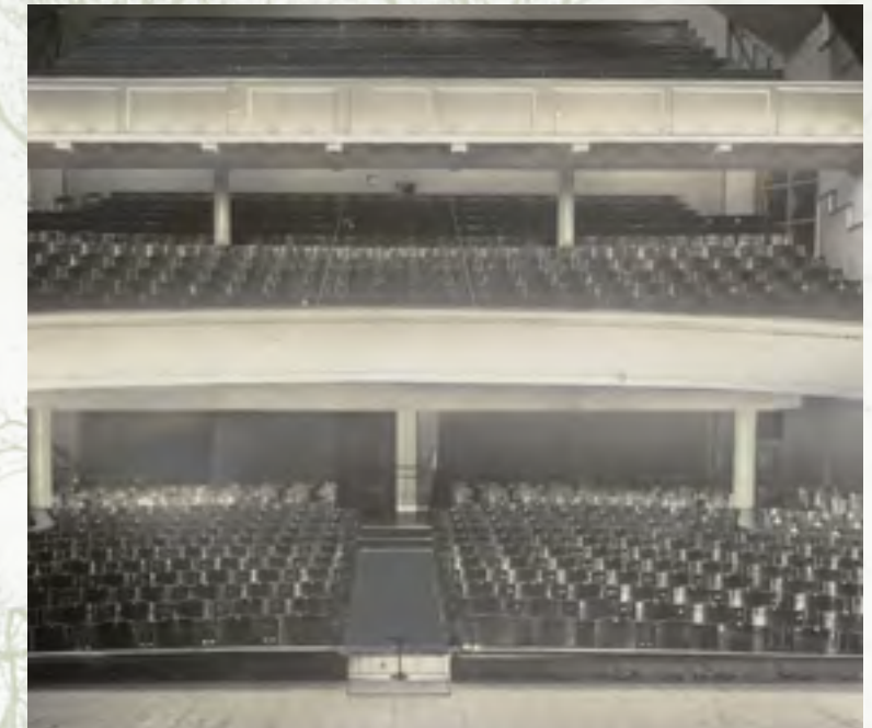
interieur, circa 1930

In 1912 kwam er bij Sociëteit Ons Genoegen de behoefte aan een nieuwe zaal voor theatervoorstellingen. De temperatuur in de oude zaal was te hoog of te laag en het toneel te klein. Net als nu bij de Kuip in Rotterdam werd er eerst gediscussieerd of een verbouwing van de oude zaal beter was of dat er toch maar gekozen moest worden om een heel nieuw gebouw neer te zetten. Voor de laatste optie werd met grote meerderheid gekozen in de ledenvergadering van 9 oktober 1912.