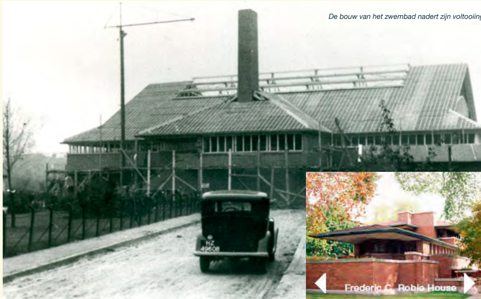
De bouw van het zwembad nadert zijn voltooiing