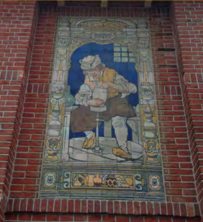
Hersteld tableau van de pottenbakker