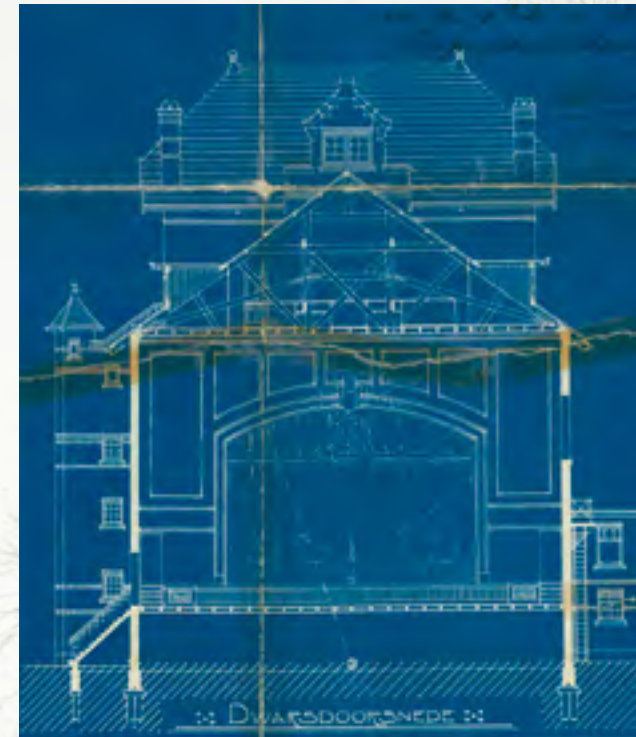
Bouwtekeningen van de schouwburg, 1913