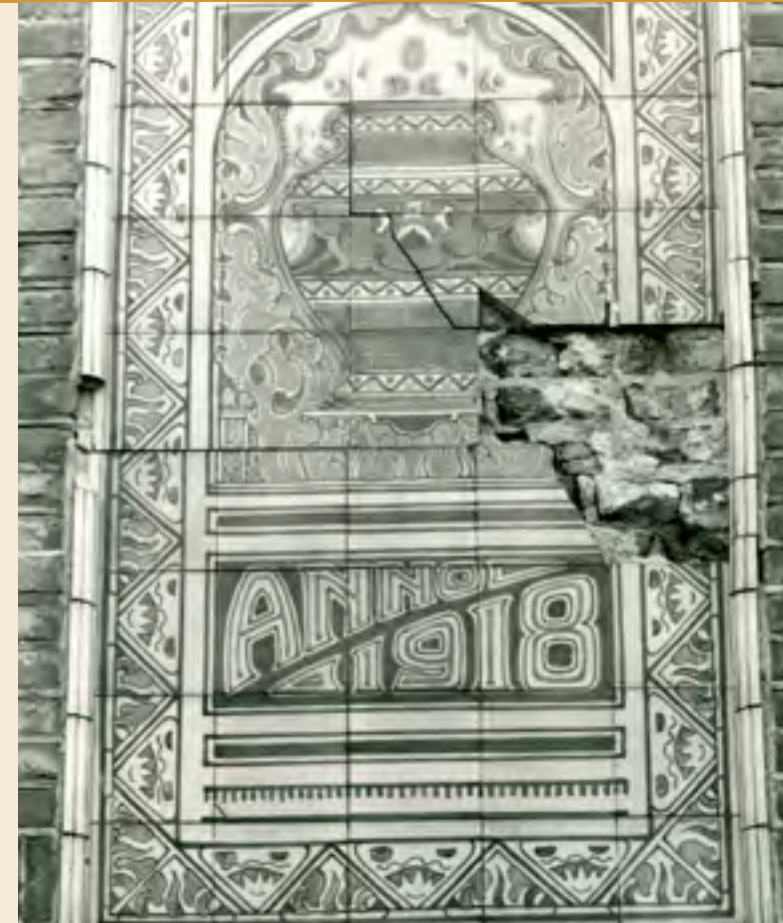
Tableau voor en na de restauratie

Gedurende zestig jaar heeft de fabriek een enorme hoeveelheid sieraardewerk geproduceerd. Koninklijke Plazuid blonk vooral uit in de beschildering van Jugendstil motieven; met name in de jaren twintig genoot het Goudse plateel grote populariteit. Vanaf de Kleischuren aan de Vest, waarvan er nog een over is, werd de kleimassa naar de afdeling kleivoorbereiding gebracht om verder in het proces te worden gebruikt. Dat de aardewerknijverheid rond de eeuwwisseling hier in Gouda zat en een zeer voorspoedige ontwikkeling doormaakte, had te maken met de aanwezigheid van klei aan de oevers van de Gouwe en de Hollandse IJssel.