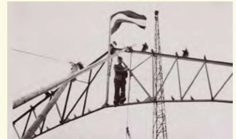
Hoogste punt bereikt in oktober 1938