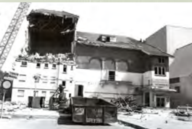
De sloop van de schouwburg op 18 mei 1992

Bij de opening op 13 november 1913 was het zo druk, dat alle plaatsen bezet waren. Zelfs op de galerij hadden de leden van de sociëteit 'hun toevlucht moeten zoeken.' De Koninklijke Vereeniging "Het Nederlandsch Toneel" voerde in 'de vriendelijke zaal met zijn practisch en modern toneel' het blijspel Principes op.