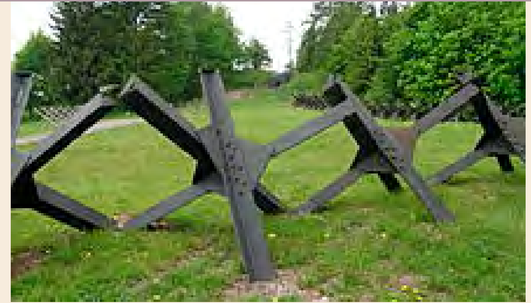
Voorbeeld van de stalen kruizen of 'Tjechische Egels' die ook bij de Bodegraafsestraatweg hebben gestaan