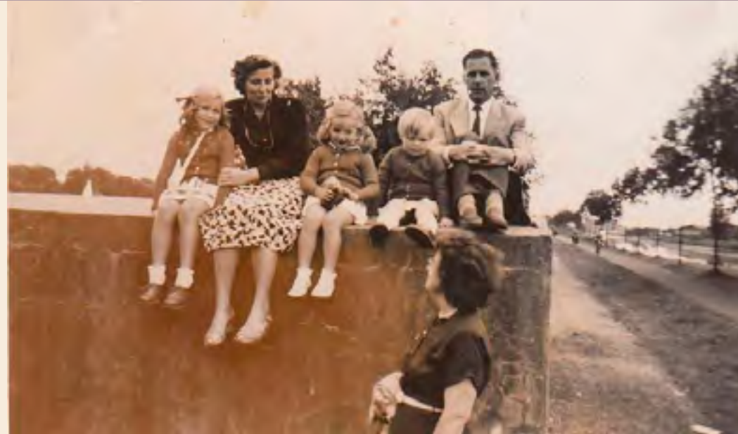
Foto genomen op het blok dat op de Burgemeester Lucassenlaan stond

Krantenartikel in de Nieuw Reeuwijkse Courant van 8 april 1955, waarin de sloop van de muren wordt genoemd