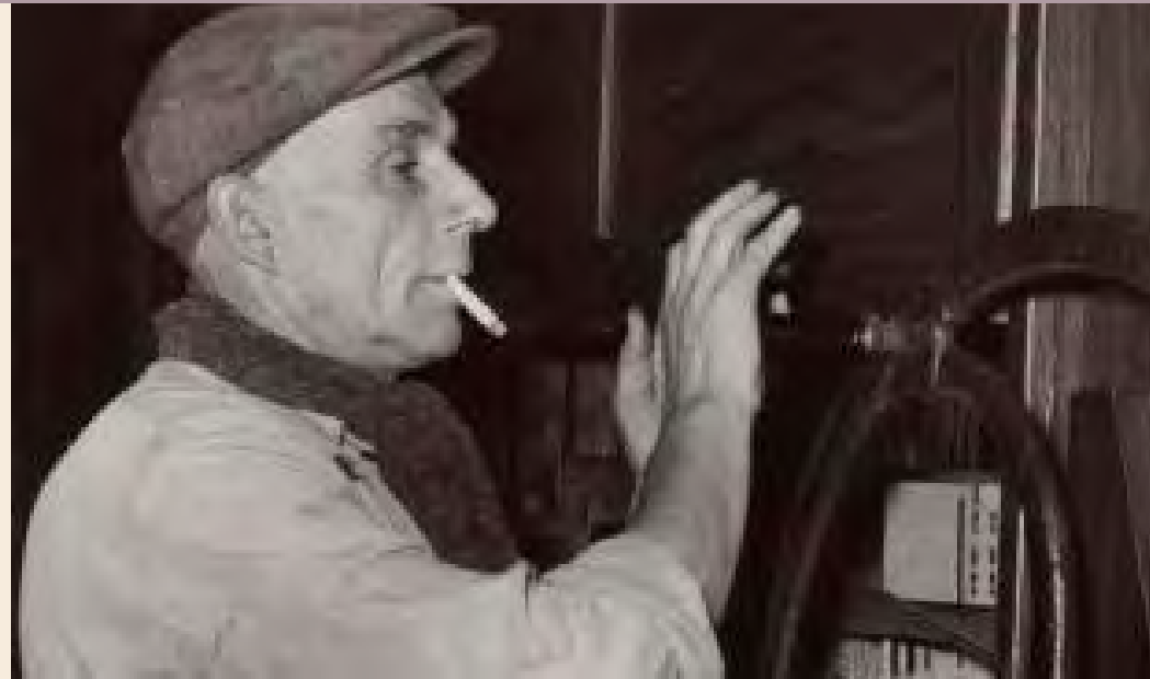
Eén van de gebroeders Tom bij het draaiorgel dat in de jaren '50 bij veel Gouwenaren een bekend fenomeen was