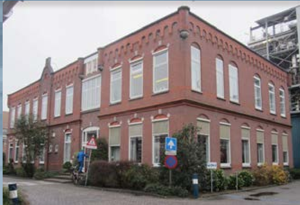
Voor- en zijgevel hoofdgebouw