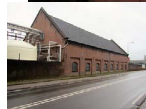
Loods aan Schielands Hoge Zeedijk