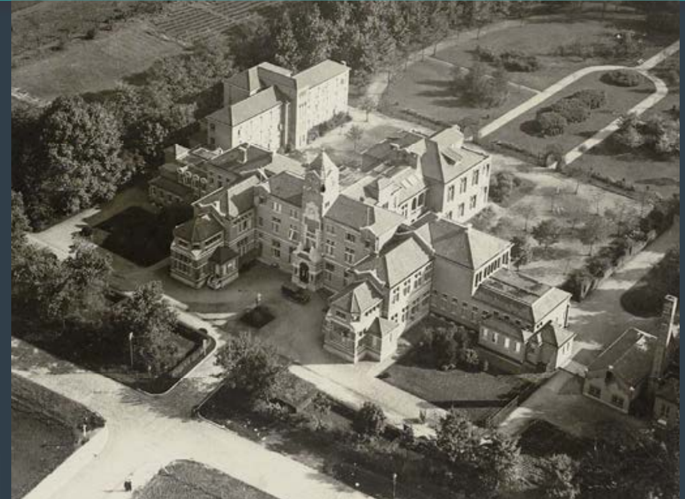
Luchtfoto van het verdwenen ziekenhuis