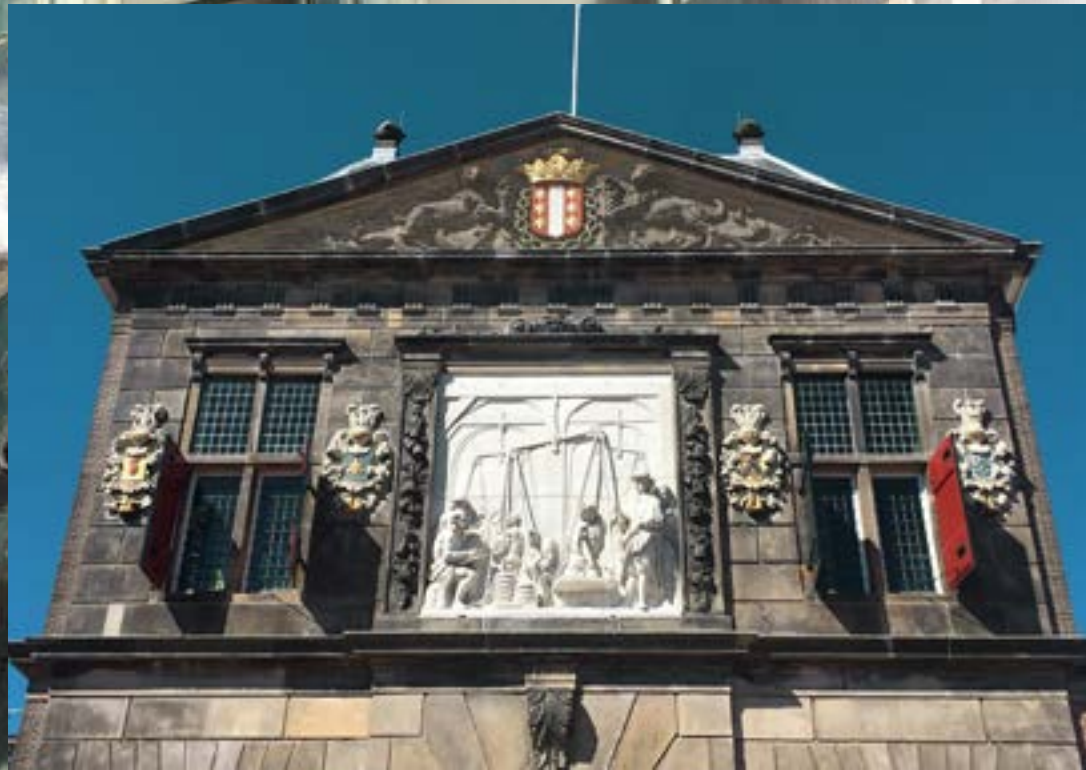
relief van het wegen van kaas van beeldhouwer Bartholomeus Eggers

‘Burgers, boeren en buitenlui...’, dat was vermoedelijk de openingszin van de stadsomroeper die hiermee de aandacht op zich vestigde en vervolgens zijn nieuwtjes deelde met bewoners en andere rondtrekkende lieden.