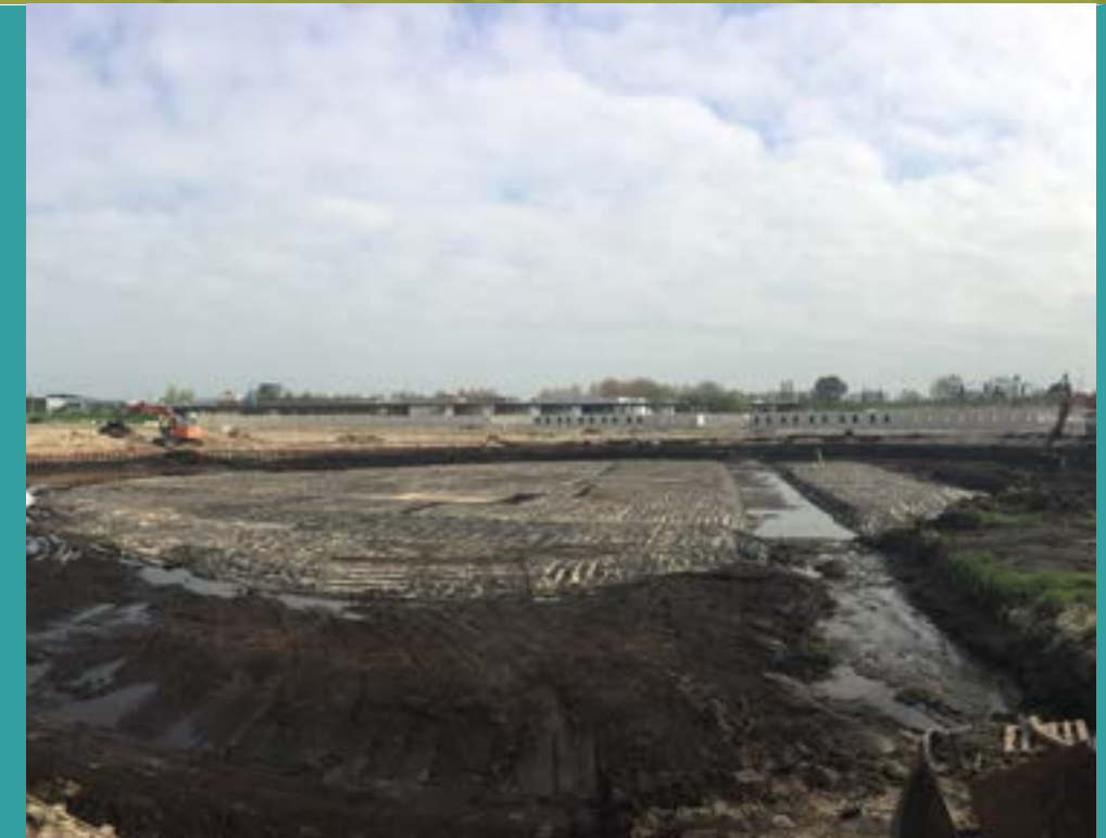
De afgedekte vindplaats

verblijf in die bodem zou voor het archeologisch materiaal dus niet slecht zijn. Integendeel: als we de vindplaats op zouden graven, zouden we al het archeologisch materiaal direct moeten conserveren om te voorkomen dat het weg zou rotten, terwijl het in de bodem gewoon goed zou blijven.