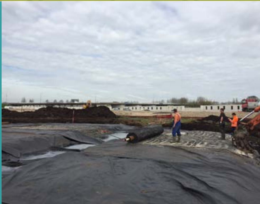
Het afdekken van de vindplaats