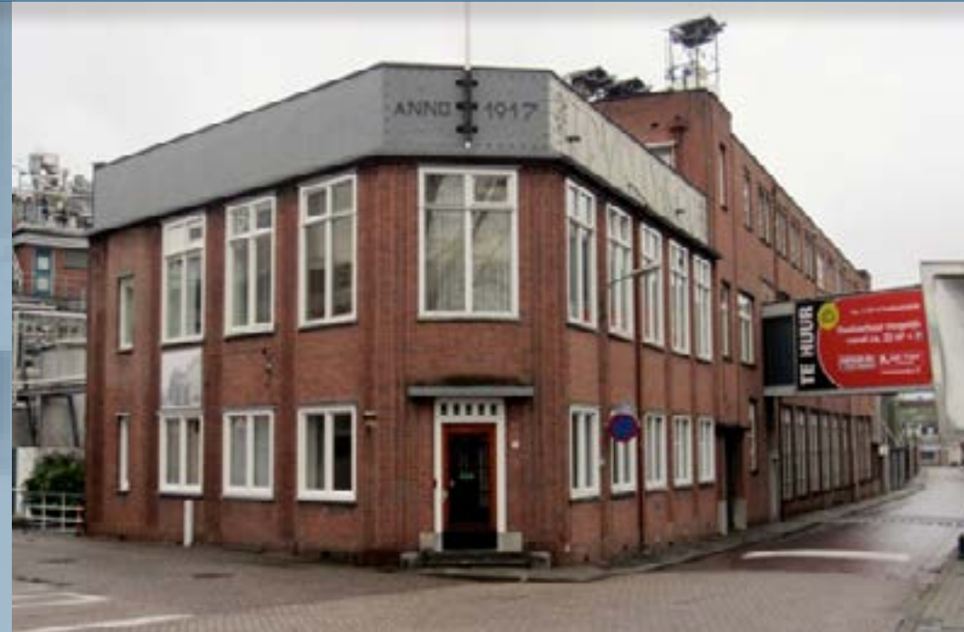
Kantoorgebouw Viruly met gevel aan Buurtje