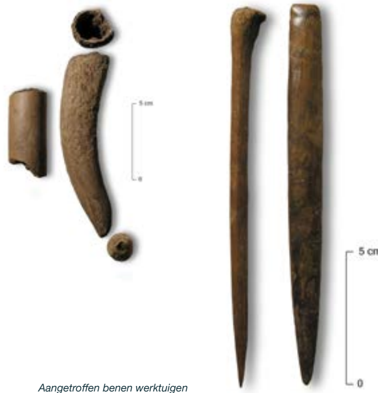
Aangetroffen benen werktuigen

Nadat het kamp is verlaten is het terrein overspoeld. Daardoor is het bedekt met een dun laagje klei en overgroeid met veen. Hierdoor is in feite de archeologische vindplaats als geheel een tijds capsule geworden, met alle sporen en werktuigen er nog in. Niemand is hier in duizenden jaren geweest. Totdat archeologen de site dus herontdekten, tijdens de voorbereidingen van de aanleg van de woonwijk Westergouwe. Een geweldige vondst!