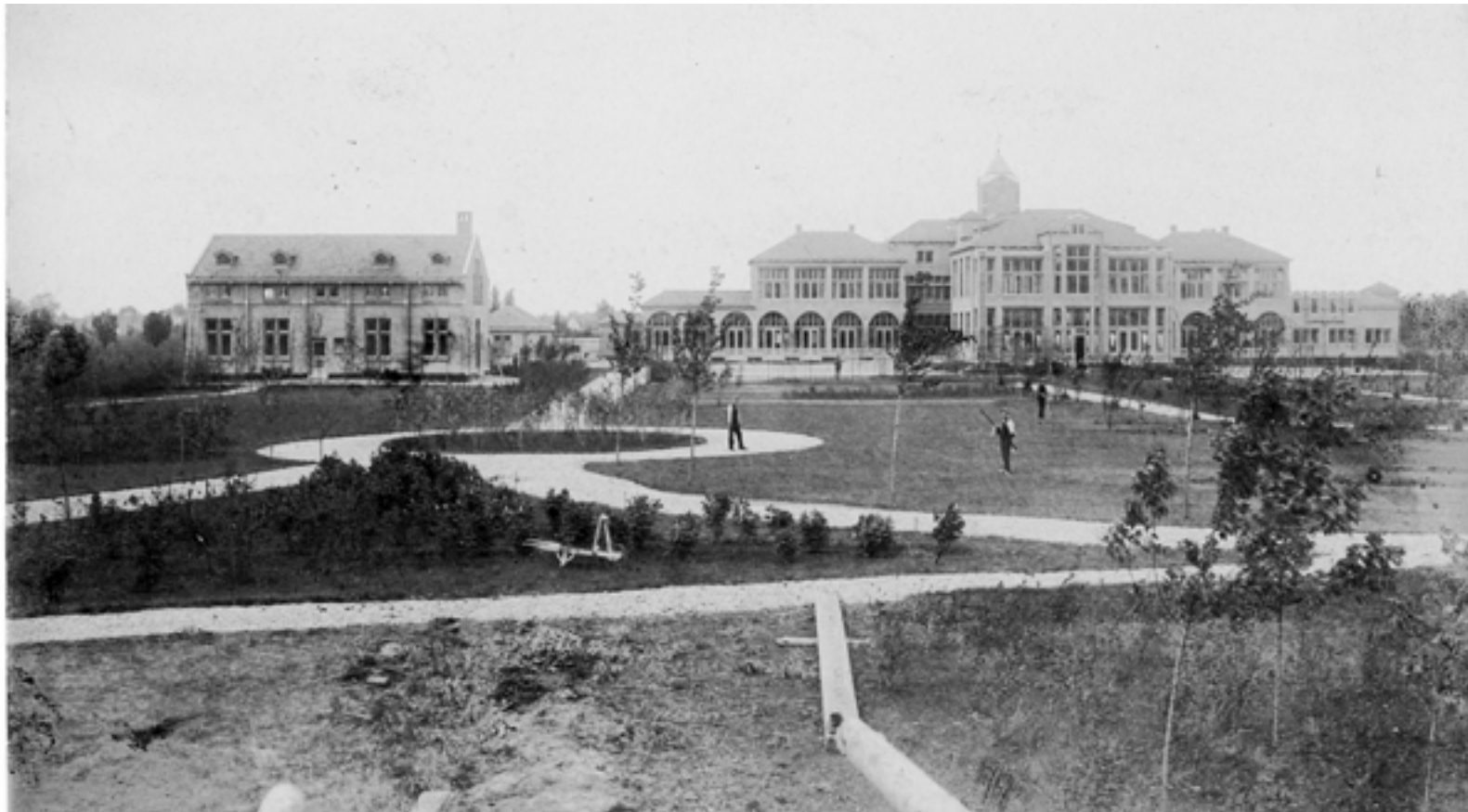
Het Van Iterson Ziekenhuis, lees meer op pagina 9

Deze keer leest u in de nieuwsbrief onder andere over Croda, die sinds kort de eigenaar is van een paar bijzondere gemeentelijke monumenten op zijn fabrieksterrein. Ook leest u over het nieuwe terrassenbeleid op de Markt. Natuurlijk besteden we ook aandacht aan archeologie: dit keer kunt u lezen over een bijzondere vindplaats in de nieuwe wijk Westergouwe. In de rubriek 'Gelukkig hebben we de foto's nog' staan we dit keer stil bij het Van Iterson Ziekenhuis. Tot slot kunt u nog lezen over de nieuwe erfgoedverordening en vertellen we vast wat er allemaal te doen is op Open Monumentendag in september.