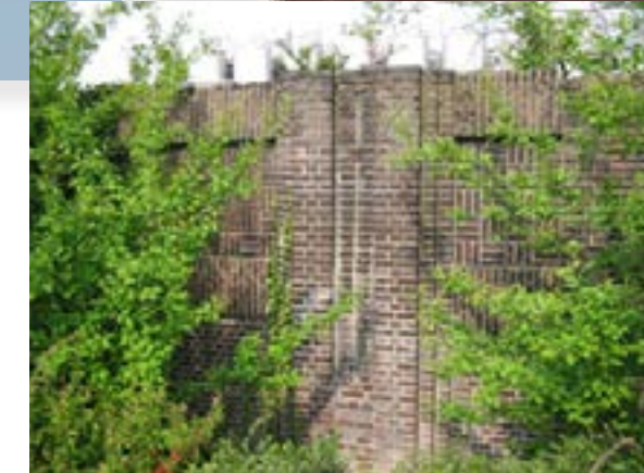
Restant van de muur