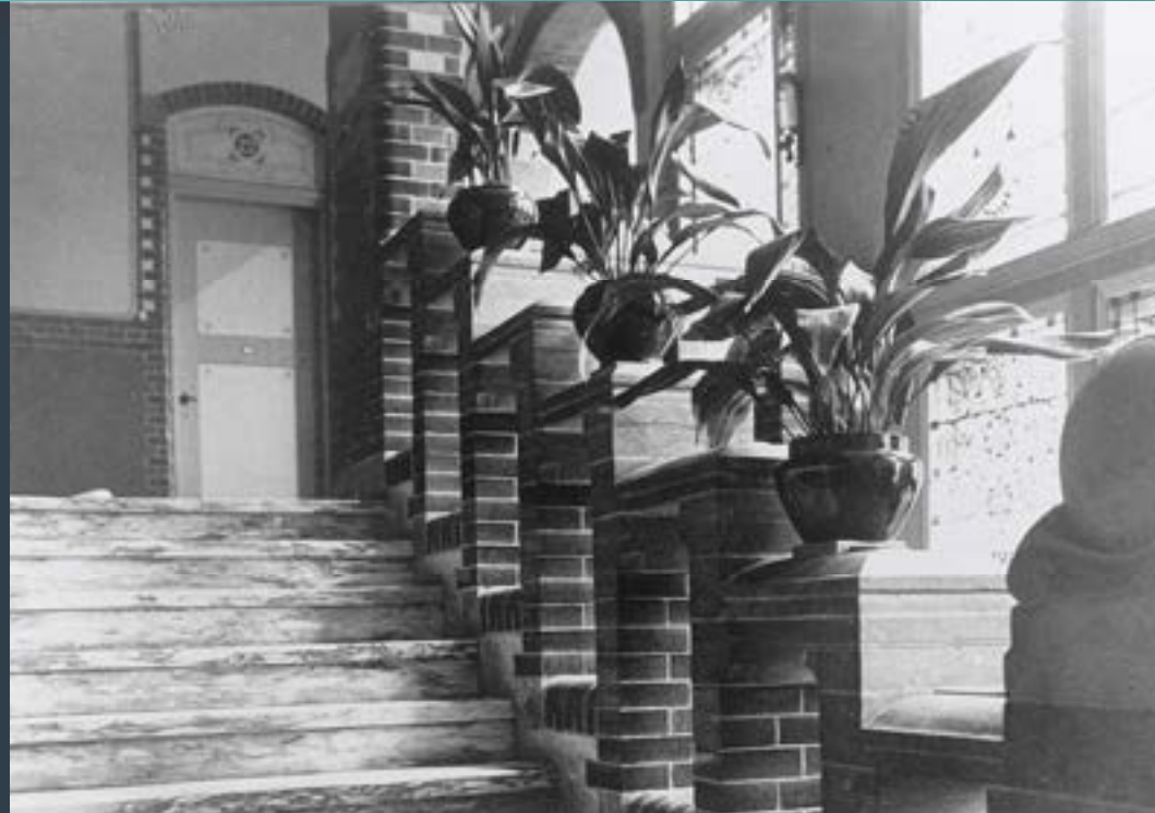
Gang en trap in het ziekenhuis