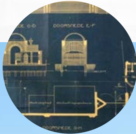
ontwerptekening muur met portiersloge, M. Brinkman, 1918