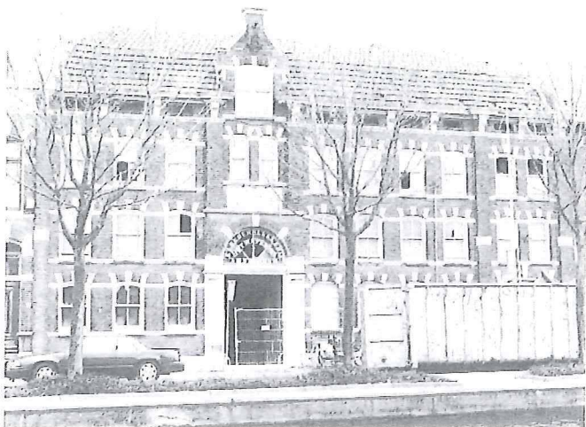
Eindelijk is het zover! De voormalige blekerij "Wapen van Amsterdam" wordt gerestaureerd.

van monumenten een projectovereenkomst ontwikkeld die in nieuwsbrief 4 al uitgebreid is beschreven. In de overeenkomst staat aangegeven wanneer van wie welke actie wordt verwacht. Voordeel van een dergelijke overeenkomst is, dat de burger voor wat betreft monumenten nog slechts te maken heeft met één afdeling, Stadsvernieuwing/Volkshuisvesting/Monumentenzorg, die de zaak binnen de gemeente coördineert.