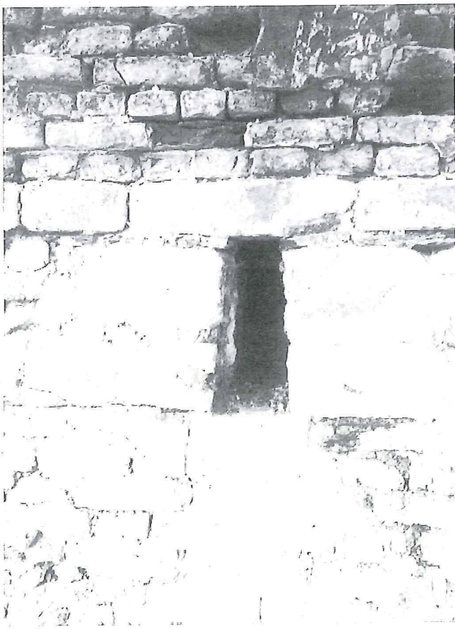
De ontleisterde stadsmuur aan de Nieuwe Veerstal. De foto toont één van de schietgaten.