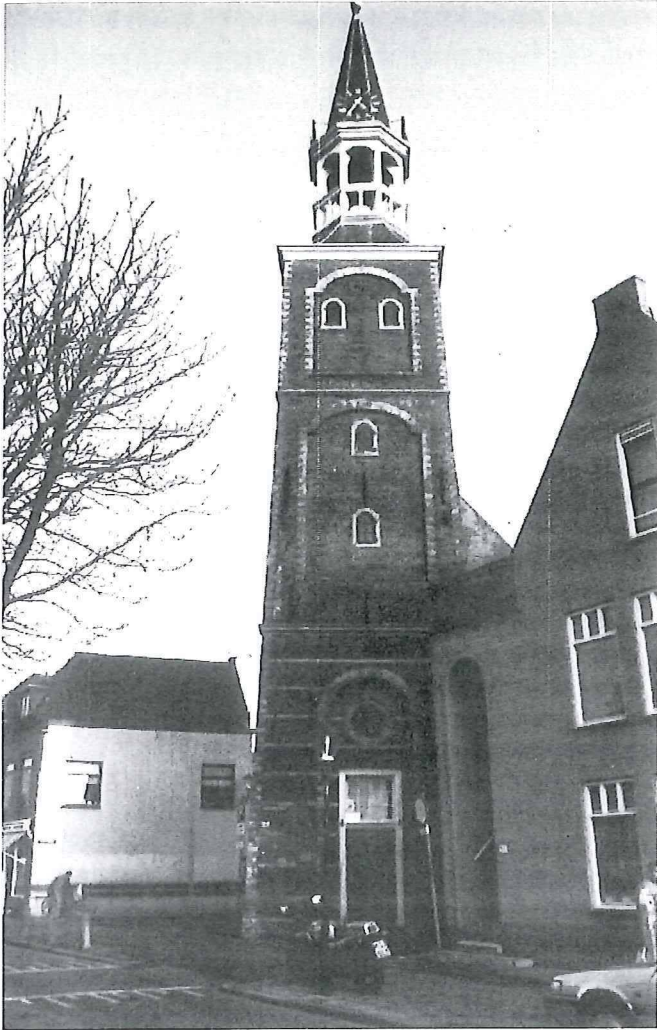
De Vrouwetoren, kort voor de restauratie.

1494 werd gebouwd. Die kapel werd na de Reformatie in 1572, in tegenstelling tot de Barbarakapel, geheel afgebroken. Maar de toren bleef ook hier gespaard.