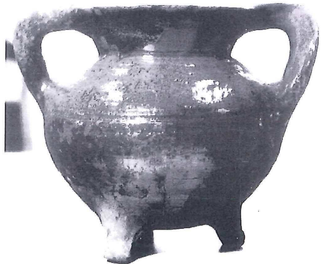
Eén van de vondsten bij de opgraving in de Keizerstraat: een grape van spaarzaam geglazuurd rood aardewerk, datering 1375-1425.