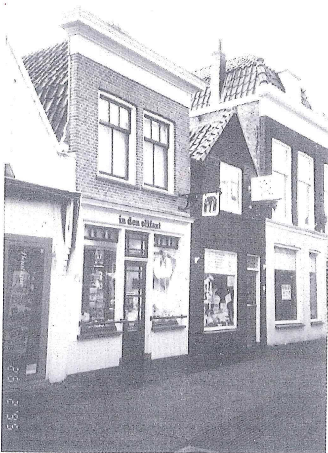
"in den olifant"; voorbeeld van een smaakvolle vormgeving en kleurstelling met ingetogen reclame.

Wandelend door het Goudse winkelgebied zoals de Markt en de eromheen gelegen winkelstraten, zien we veel panden waarbij de oorspronkelijke gevelstructuur op de begane grond totaal is verdwenen. De gevels zijn vaak horizontaal in tweeën gedeeld door luifels en opzichtige reclames en het verband tussen onder- en bovengevel is geheel