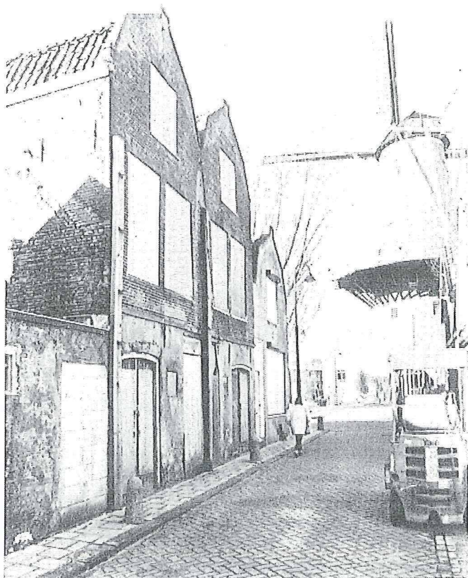
de panden Vest 160-162 die na archeologisch onderzoek zullen worden gerestaureerd.

Nabij molen de Rode Leeuw staan de panden Vest 160 en 162. Deze panden zijn nog niet zo lang geleden op de gemeentelijke monumentenlijst geplaatst en zullen worden gerestaureerd. De eigenaren bleken bereid de start van de bouwwerkzaamheden op te schorten om archeologisch onderzoek mogelijk te maken. Hierdoor kon op een bijzonder interessante plaats onderzoek worden gedaan. De plaats is zo interessant omdat voor de achtergevels van de panden de oude stadsmuur is gebruikt. Ondergronds bleken zich tevens nog de funderingen van de muur en een steunbeer te bevinden. Het steenformaat duidde op een in de zeventiende eeuw gebouwd of gerepareerd gedeelte. In de panden, dicht tegen de stadsmuur, werd